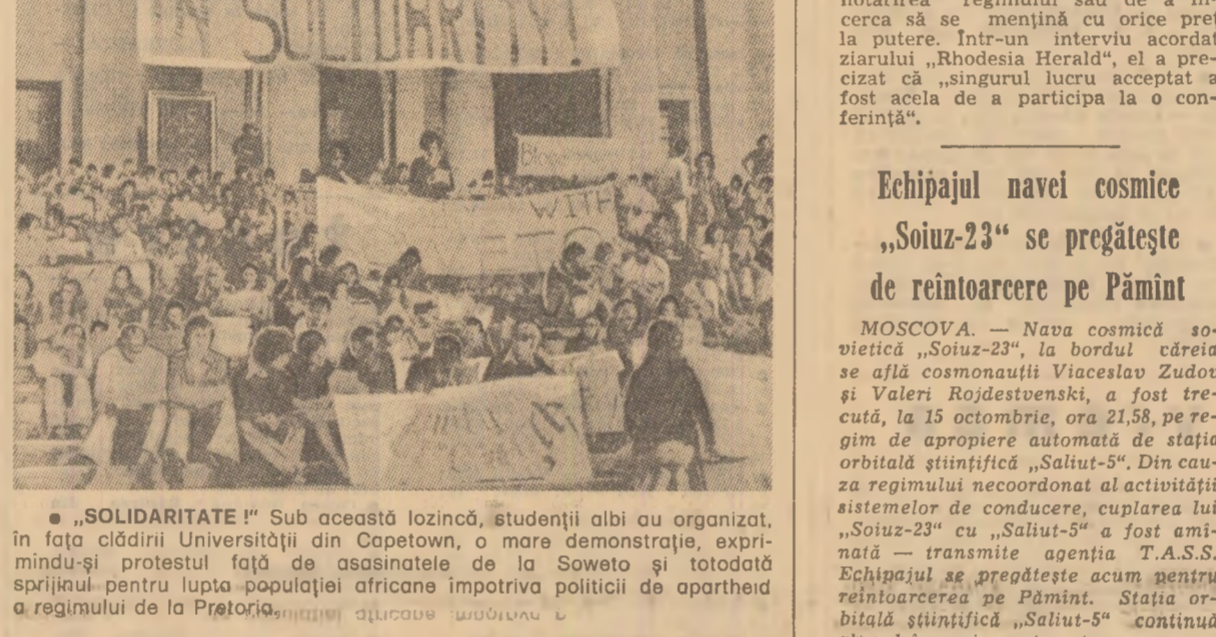
„SOLIDARITATE” Sub această lozincă, studenții albi au organizat, în fața clădirii Universității din Copetown, o mare demonstrație, exprimîndu-și protestul față de asasinarea de la Soweto și totodată sprijinul pentru lupta populației africane împotriva politicii de apartheid a regimului de la Pretoria.