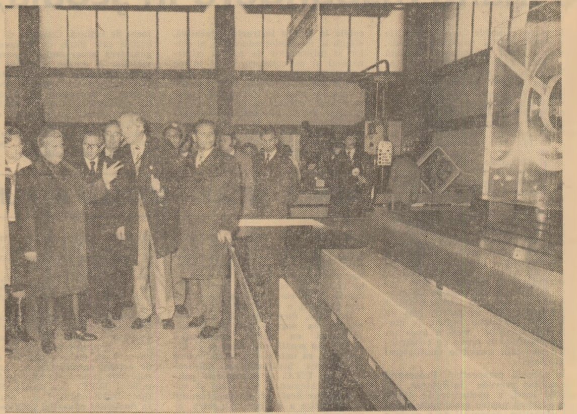
In vizită la câteva din pavilioanele firmelor de peste hotare