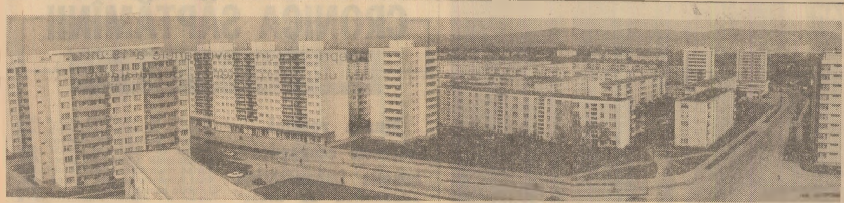
Sibiu — Noul cartier de locuințe Hipodrom.