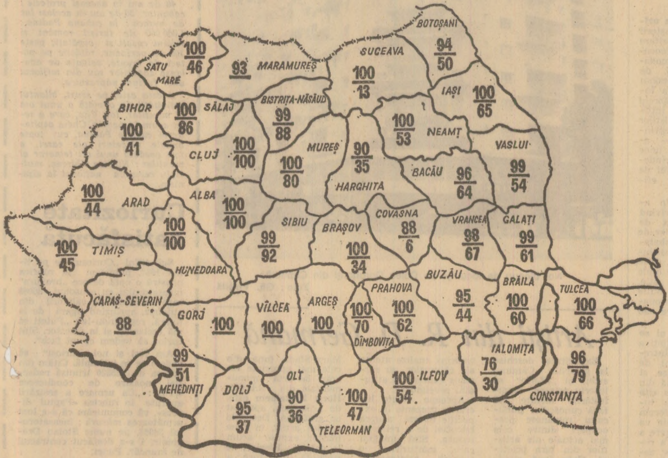
Stadiul recoltării cartofilor și sfeclei de zahăr în cooperativile agricole la data de 20 octombrie a.c. Cifrele înscrise în perimetrul fiecărui județ reprezintă suprafața de pe care s-a strins recolta, în procente, la cartofi (sus) și sfeclă de zahăr (jos)

Pînă ieri, potrivit datelor furnizate de Ministerul Agriculturii și Industrii Alimentare, recolta de cartofi a fost strinsă de pe 108 530 hectare, ceea ce reprezintă 96 la sută din suprafața cultivată. Așa cum rezultă din cifrele înscrise pe harta de mai sus, cooperativile agricole din 22 de județe au încheiat această lucrare. Acum, toate fermele trebuie concentrate la transportul și însoțirea cartofilor. Centrarea pentru legume și fructe recomandă: • să fie transportați urgent toți cartofii aflați în grămezi pe cîmp • cartofii rămași peste noapte să fie acoperiți • să se folosească la maximum benzile transportoare și alte utilaje pentru încălzirea în vagoane • să se continue însoțirea • să se verifice periodic toți cartofii din depozite, pentru a se preveni pierderile.