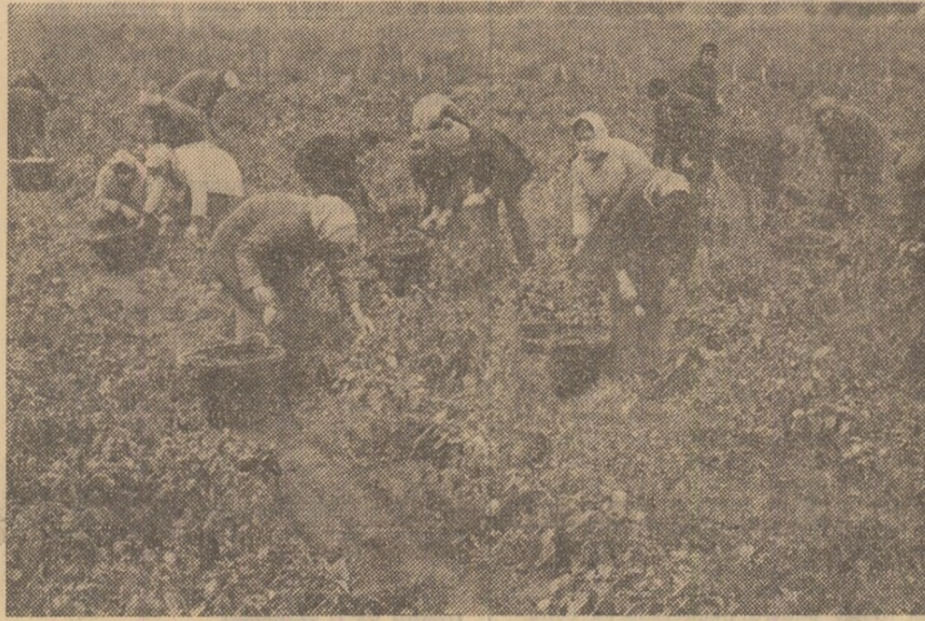
Amplă participare la muncă pentru a grăbi culesul porumbului din lanurile cooperativei agricole „Milcovul”, județul Vrancea (fotografia din stînga), și a legumelor în grădina întreprinderii agricole de stat „Dundrea”, județul Brăila.

Trimișii speciali și corespondenții „Științei” din întreaga țară relatări privind stringerea, transportul și depozitarea recoltei