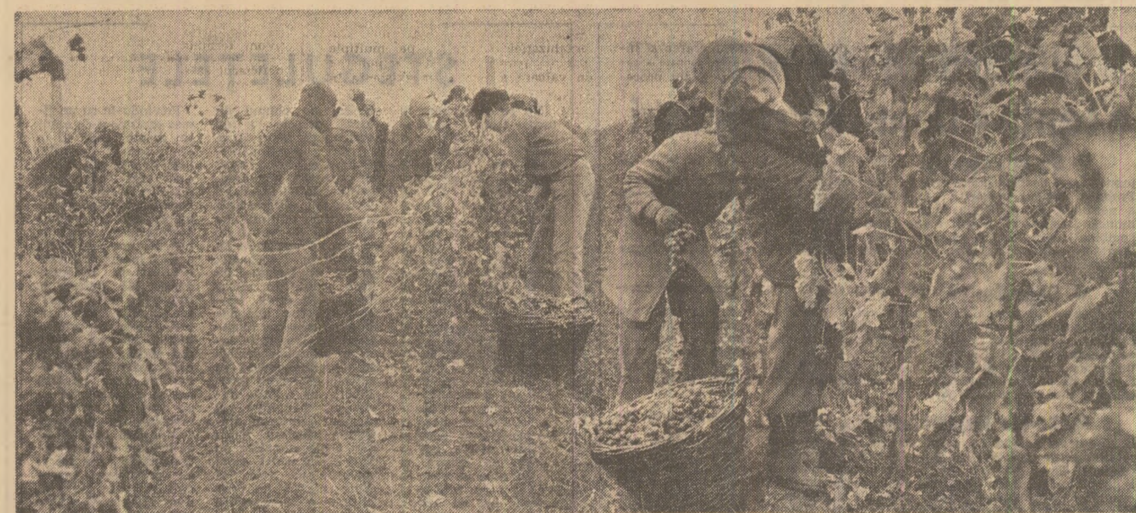
Culesul strugurilor la cooperativa agricolă din comuna Urechești, județul Vrancea.

Parcurgem zeci și zeci de kilometri printr-un peisaj de toamnă aspră, dar animată de patosul muncii, într-o zi cînd mil de oameni au leșit în cîmp pentru a pune la adăpost recolta. Ne grăbim să ajungem în ținuturile Vrancei, acolo unde acum forțe umane considerabile sînt concentrate pe dealurile cu viță de vie, în marile podgorii. Dar pînă acolo străbatem zona de ses a județului Vrancea. Și aici — sute și mii de oameni pe cîmp. La Măicînești, sfecla scoasă din pămînt de pe cîteva zeci de hectare trebuie decolețată și trimisă la fabrică. — Aici sînt pe urgia ala, am fost la porumb. Azi — la sfeclă, ne spune