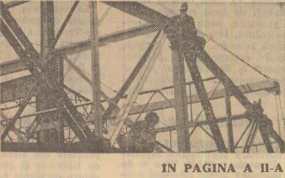
IN PAGINA A II-A

Aprovizionarea șantierelor, închiderea halelor, întărirea ordinii și disciplinei