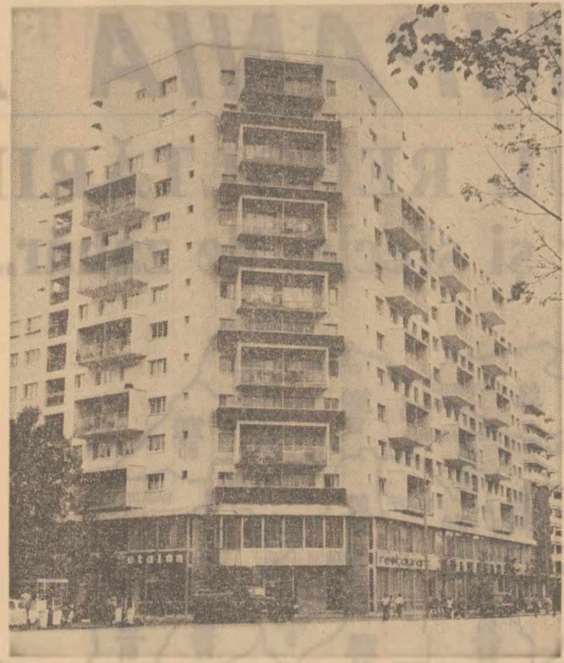
Noi blocuri de locuințe pe Calea Dorobanți din Capitală