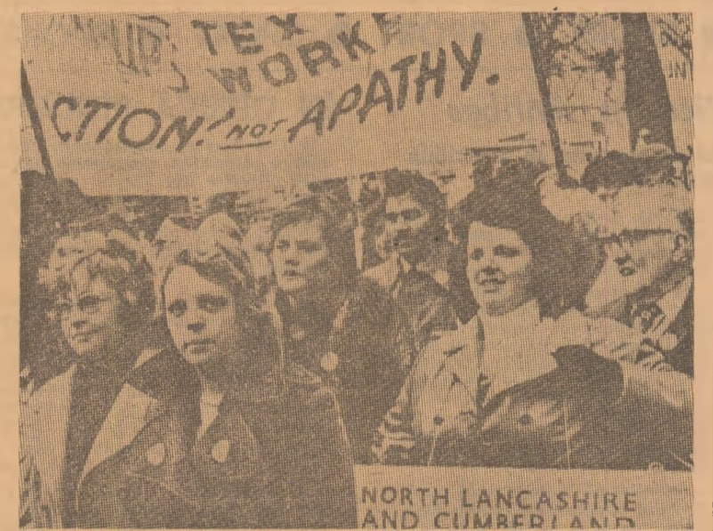
„Muncitorii textiliști, nu fiți pasivi — acționați!” — este chemarea înscrisă pe pancartele purtate la o demonstrație de protest împotriva intențiilor patronatului de a depăși dificultățile din industria textilă britanică prin reducerea locurilor de muncă