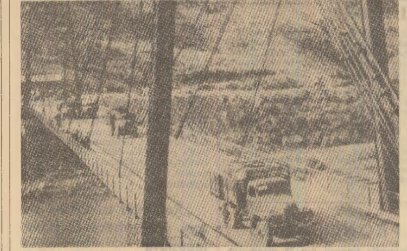
Lucrările de reconstrucție a magistralei feroviare transvietnameze „Reunificarea” (1 680 km), care leagă orașele Hanoi și Ho Și Min, avansează rapid. Luna aceasta, constructorii au anunțat terminarea podurilor care traversează riurile Dong Hoi și Giann. În imagine: la circa o sută de kilometri de orașul Hue, peste apa rîului Ba Long, se arcuiește un nou pod suspendat, de curînd intrat în circuitul rutier