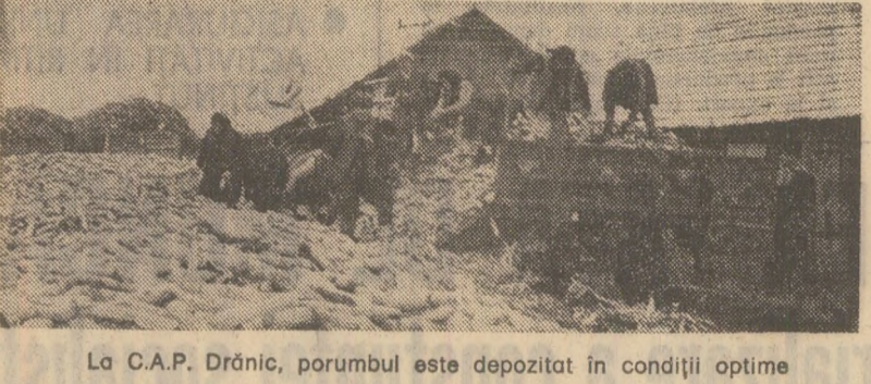
La C.A.P. Drânc, porumbul este depozitat în condiții optime

2 500 tone struguri. Au participat la lucru, în medie pe zi, 72 060 oameni. (Mircea Bunea). NEAMȚ: În săptămîna care s-a încheiat, oamenii muncii de pe ogoarele județului Neamț au reușit să pună la adăpost întreaga recoltă de legume, fructe, struguri și cartofi. De pe cîmp au fost transportate 80 000 de tone de diferite produse. Duminică au fost prezenți pe ogoare peste 32 000 de oameni, care au muncit mai ales la culesul porumbului. (Ion Manca). BIHOR: Printr-o mare mobilizare de forțe materiale și umane, în județul Bihor s-au încheiat duminică recoltarea, transportul și depozitarea tuturor cantităților de cartofi de pe 1 885 ha, a tomaterilor de pe 1 690 hectare și a ardeiiului de pe 648 hectare. Continuă transportul și însolozarea sfeclei de zahăr, însămintarea grului pe ultimele 2 000 hectare. (Dumitru Găță).