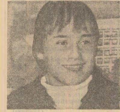
NADIA — LA ANTIBES

Cotidianul „L’Humanité” publică pe prima pagină fotografia Nadei Comănci, care, împreună cu colegii ei din echipa României, a participat, la sfîrșitul săptămînii trecute, la Gala de gimnastică din localitatea franceză Antibes.