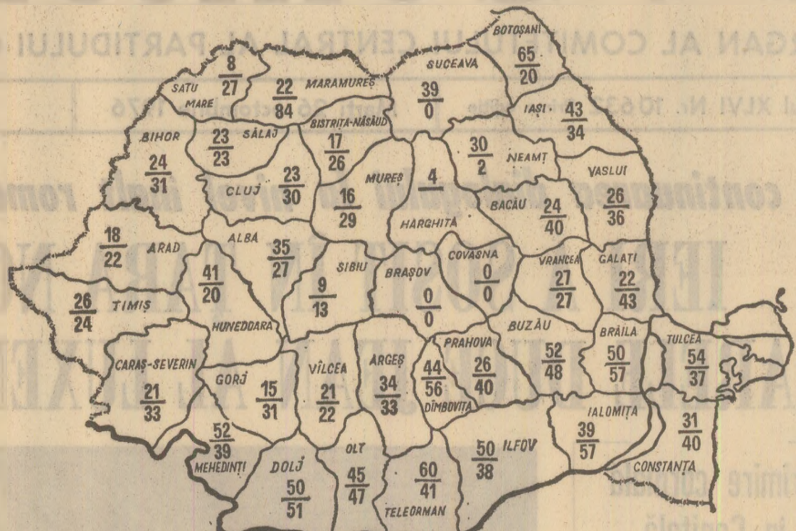
Stadiul recoltării porumbului la 25 octombrie. Cifrele înscrise în perimetrul fiecărui județ reprezintă suprafața de porumb care s-a strins în cooperativele agricole — sus, și în întreprinderile agricole — jos