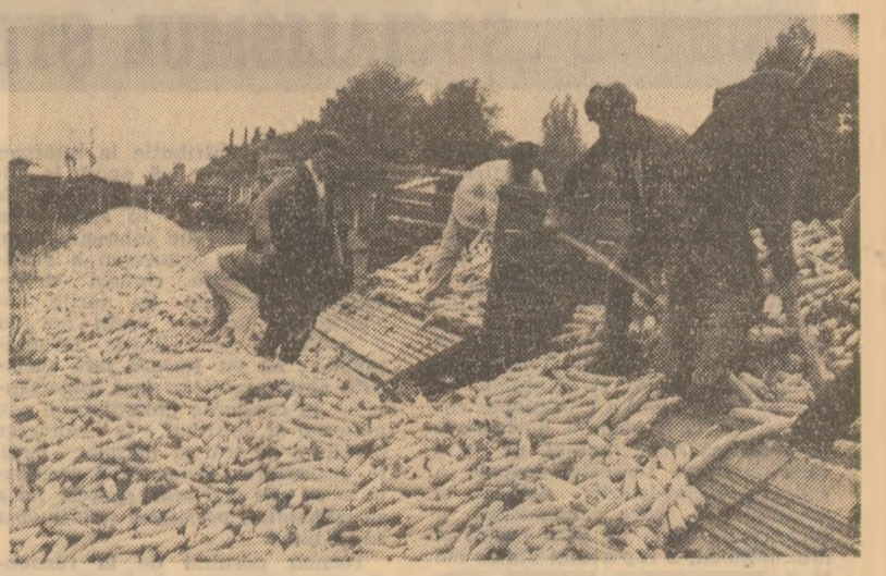
Două lucrări a căror bună desfășurare în aceste zile necesită o temeinică organizare a muncii. Transportul tuturilor cantităților de porumb cules și aflat pe cîmp în grămezi - fotografia din stînga, și depozitarea în cele mai bune condiții a stuleților, pe categorii de umiditate - fotografia din dreapta

INSĂMINȚĂRILE. La 28 octombrie mai erau de semănat 91.400 ha cu grâu. Sînt necesare măsuri pentru executarea grăbnică a lucrărilor de eliberat, arat și pregătire terenul în flux continuu, pentru încheierea în cel mult 3-4 zile a însămînțării pe toate suprafețele planificate. În mod deosebit se cere urgentarea acestor lucrări în județele Botoșani, Suceava, Neamț, Iași, Vâlcea, Argeș, Gorj și Teleorman, unde sînt și cele mai mari întîrzieri.