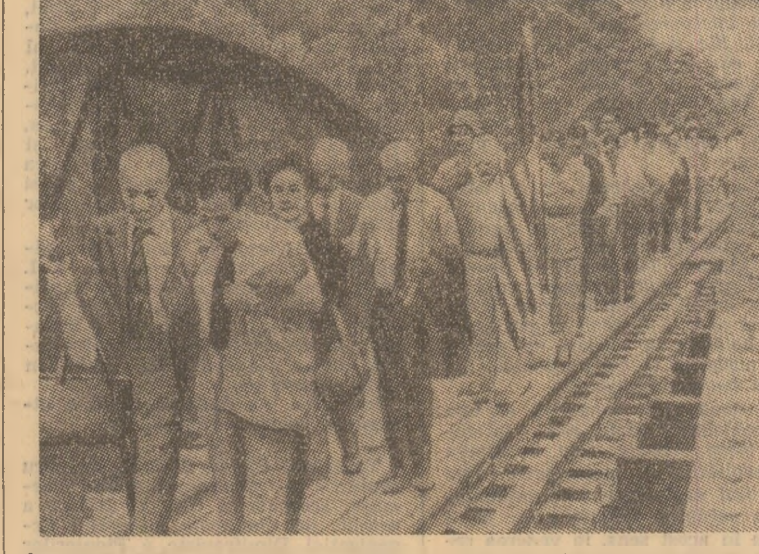
În cadrul unei ceremonii speciale, a fost cinstită memoria miilor de prizonieri de război care au pierit, în 1943, într-un lagăr de muncă al militarilor niponi, în cursul construirii famosului pod de peste râul Kwai, de la granița dintre Tailanda și Birmania. Prezența la fața locului a unui grup de supraviețuitori (în imagine) a constituit încă un prilej de a se evidenția necesitatea unirii forțurilor tuturor popoarelor pentru a nu se mai permite repetarea ororilor războiului.