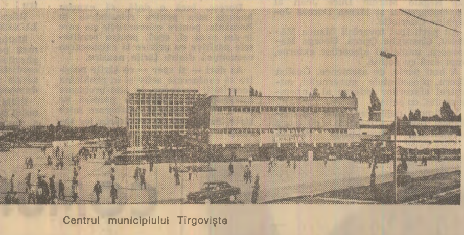
Centrul municipiului Tîrgoviște