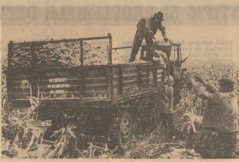
Două lucrări a căror bună desfășurare în aceste zile necesită o temeinică organizare a muncii. Transportul tuturilor cantităților de porumb cules și aflat pe cîmp în grămezi - fotografia din stînga, și depozitarea în cele mai bune condiții a stuleților, pe categorii de umiditate - fotografia din dreapta