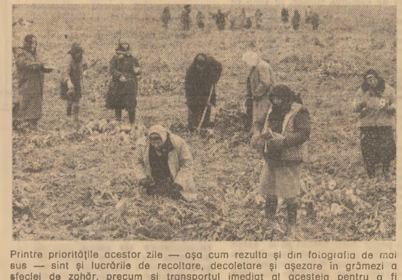
Printre prioritățile acestor zile - așa cum rezulta și din fotografia de mai sus - sînt și lucrările de recoltare, decolarea și așezarea în grămezi a sticlei de zahăr, precum și transportul imediat al acesteia pentru a fi insiloizată.

VRANCEA: Înainte de declanșarea actualei campanii de recoltare, în județul Vrancea s-a trecut la materializarea unei inițiative privind urgentarea transportului la porumb și aceeași prin confecționarea unor utilaje proprii din materiale recuperabile și desuiri. În prezent, pe ogoarele județului sînt folosite aproape 200 de buncăre suspendate și platforme transportoare. O singură platformă, de exemplu, poate transporta o dată cantitatea de coceni recoltați de pe aproape un hectar. În felul acesta, o platformă substituie trei remorci pe zi, care sînt utilizate în alte activități. De asemenea, se face economie de tractoare și carburanți. În același timp se urgentază eliberarea terenului, efectuarea arăturilor a-dînei și pregătirea terenului pentru culturile de primăvară.