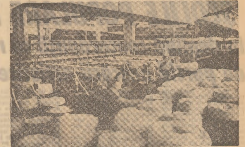
În secția filatură a întreprinderii „Tirnov” din Medioș

După părerea noastră, pentru a elimina toate cauzele care determind apariția unor neajunsuri în activitatea economică a unor unități, cea mai eficientă formă de intervenție este „controlul complex” desfășurat în întreprinderi. De pildă, spre sfîrșitul anului trecut, la întreprinderea de utilaje și piese de schimb din Botoșani s-au înregistrat rezultate mai slabe care vădeau existența a numeroase deficiențe în organizarea producției. Controlul complex, pe care biroul comitetului județean de partid a hotărît să-l efectueze în această întreprindere, organele de control muncitoresc, a avut drept scop nu numai să relieve neajunsurile, să precizeze cauzele și