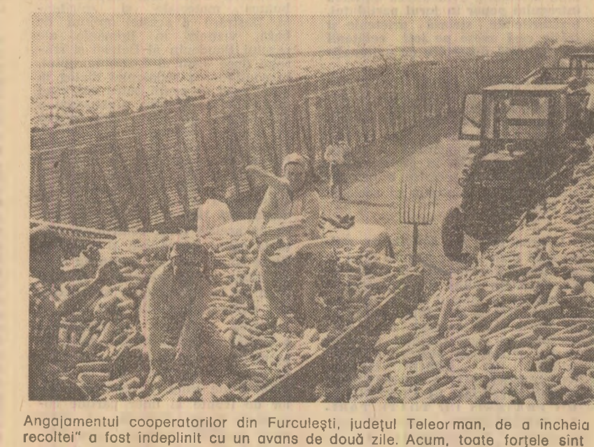
Angajamentul cooperativilor din Furculești, județul Teleorman, de a încheia recolta porumbului pînă la „Ziua recoltei“ a fost îndeplinit cu un avans de două zile. Acum, toate forțele sînt concentrate la transportul și eliberarea terenului.

Stadiul lucrărilor la 30 octombrie în județele Brăila, Buzău, Botoșani, Prahova, Galați și Arad