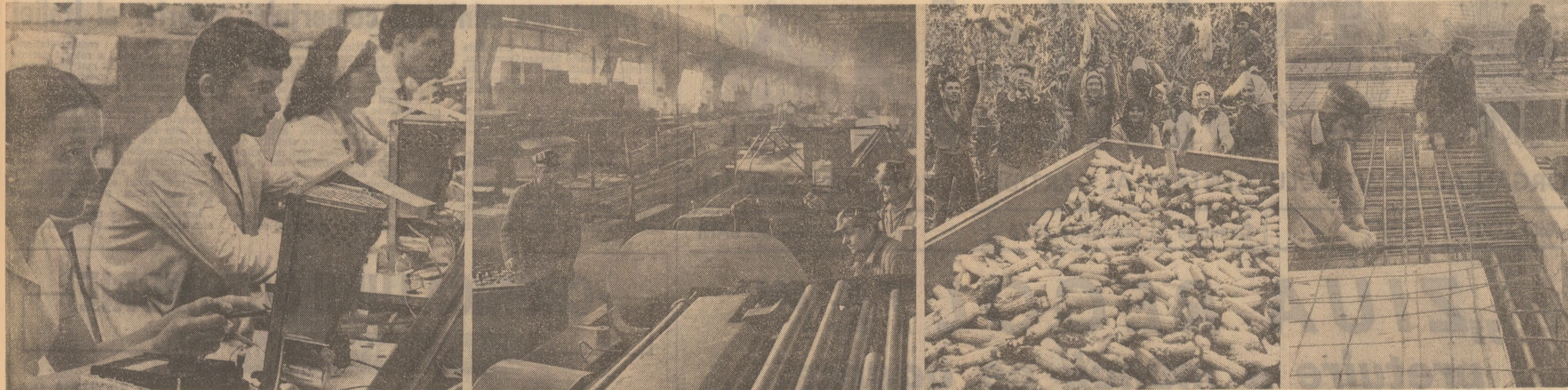
Imagini de muncă din zilele acestei toamne

Retrospectiva evenimentelor pe care în țara noastră în cursul lunii octombrie relevă că încheiem o perioadă de intensă activitate pe toate planurile politice, economice, culturale-educative. Și aceasta a fost o lună de muncă avântată, care a pus în evidență, deosebit de puternic, hotărârile cu care partidul și masele largi ale oamenilor muncii, întregul popor acționază în toate domeniile pentru realizarea obiectivelor stabilite de Congresul al XI-lea, a prevederilor primului an al actualului cincinal.