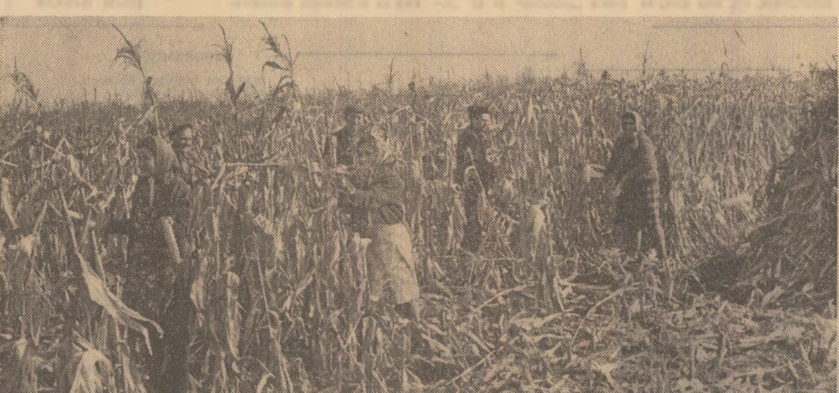
Recoltatul porumbului se apropie de sfîrșit la cooperativa din Diniș-Timiș, unde zilnic se recoltează circa 40 de hectare