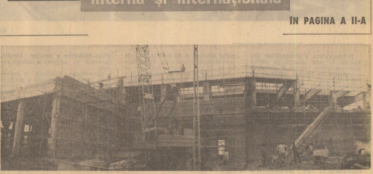
Activitate intensă pe șantierul Combinatului de articole tehnice din cauciuc Jilava