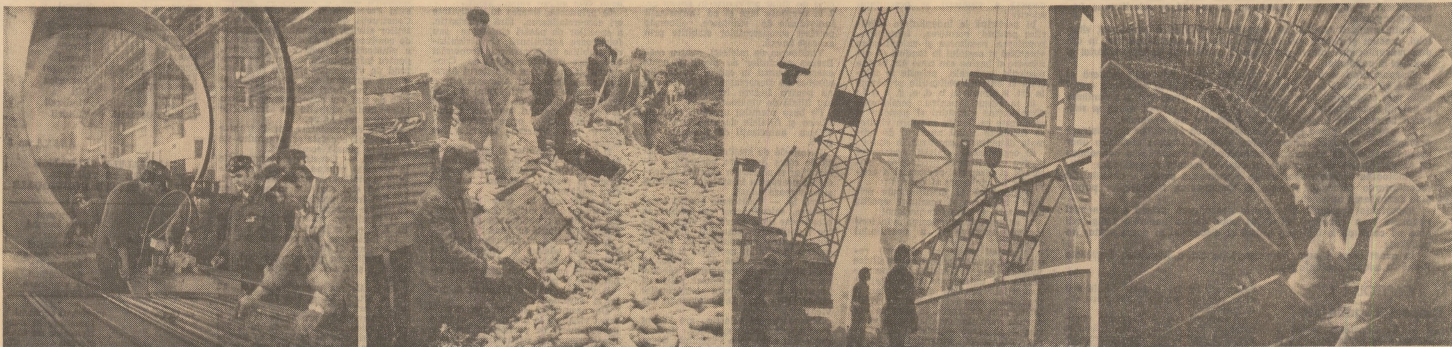
În industrie, pe șantiere, în agricultură oamenii muncii acționează cu hotărâre pentru a asigura îndeplinirea exemplară a sarcinilor subliniate la recenta plenară a C.C. al P.C.R.