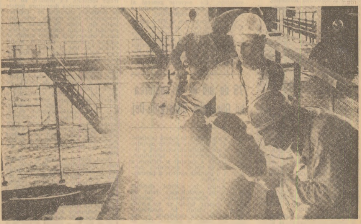
Tempul bun de lucru — pe deplin fructificat. Aceasta este deviza constructorilor și montajorilor de pe șantierele întreprinderii de mașini grele București, de unde am surprins această imagine de muncă rodnică.

logului la nivel înalt de la București și Teheran, s-a apreciat că, pe baza dezvoltării dinamice a economiilor celor două țări, se creează noi posibilități pentru intensificarea și diversificarea conlucrării româno-iraniene în industrie, în alte domenii ale economiei, spre binele și în interesul celor două popoare. S-a apreciat că dezvoltarea și adîncirea relațiilor economice bilaterale, buna concurență în domeniul politicii externe, corespund intereselor celor două popoare, contribuie la democratizarea vieții internaționale, la instituționalizarea unor raporturi noi, democratice, între popoare, servesc ca zădărnici, progresului și înțelegerii în lume. Întrevederea a decurs într-o atmosferă de căldură cordialitate și prietenie.