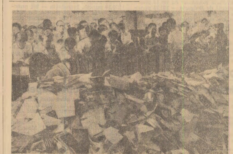
În Tailanda, autoritățile continuă acțiunile represive antipopulare, închisoarele fiind pline, în ora actuală, cu militanți ai forțelor de stînga, în general ai mișcării de luptă pentru democrație. În același timp, se desfășoară campania de distrugere a literaturii progresiste, miș și miș de cărți considerate „subversive” fiind adunate și arse - așa cum se vede în imagine - pe străzile și în piețele orașelor