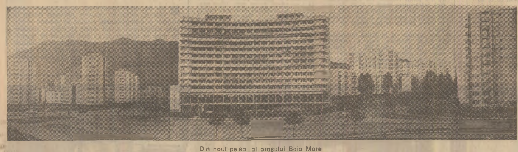
Din noul peisaj al orașului Baia Mare

Indiscutabil, în condițiile unei economii dinamice, moderne, cum este economia României, dezvoltarea în ritmurile înalte stabilite nu poate fi înțeleasă numai sub latura sa cantitativă, importantă, desigur, ci mai ales sub aspectul calitativ, de eficiență — care înseamnă, de fapt, fructificarea cu maximum de rezultate economice a potențialului tehnic, material și uman de care dispune țara noastră. Tocmai de aceea, plenara Comitetului Central al partidului cheamă organele și organizațiile de partid, conducerile ministerelor, întreprinderilor și centralelor, pe toți oamenii muncii să desfășoare acțiuni energice, perseverente, hotărîte pentru a se obține producții tot mai mari, sporuri tot mai importante de venit național pe seama reducerii accentuate a cheltuielilor de producție și, în primul rînd, a celor materiale, creșterii productivității muncii, gospodării cu înaltă responsabilitate a tuturor capacită-