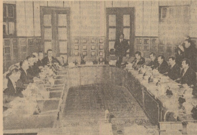
In timpul convorbirilor oficiale