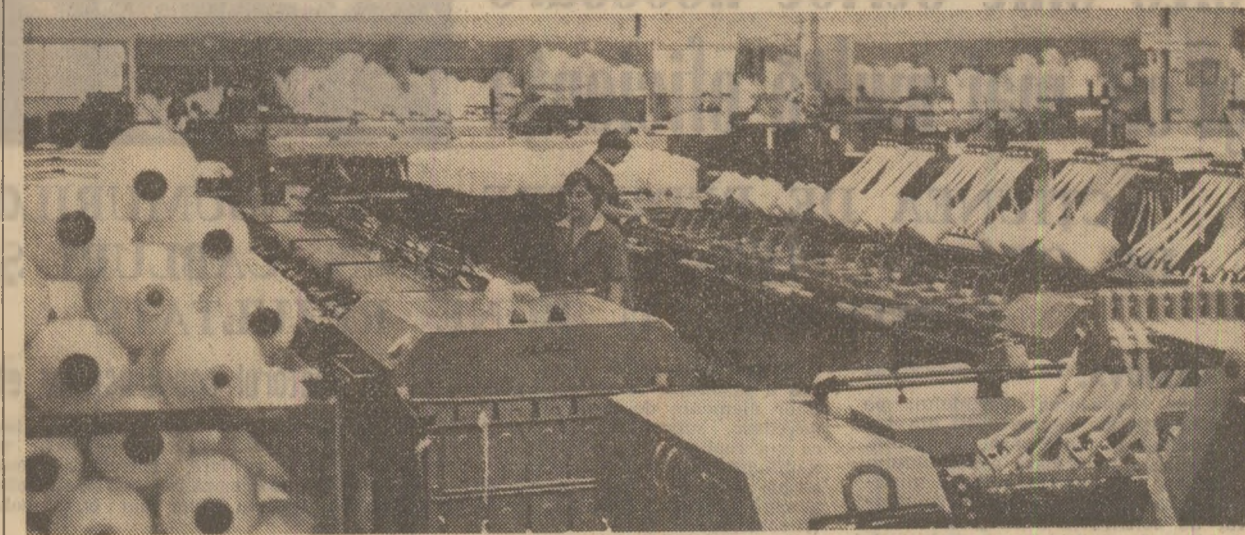
Aspect din secția preparăției a Filaturii de lînă pieptănată din Miercurea-Ciuc

La invitația tovarășului Nicolae Ceaușescu, secretar general al Partidului Comunist Român, președintele Republicii Socialiste România, tovarășul Leonid Ilici Brejnev, secretar general al Comitetului Central al Partidului Comunist al Uniunii Sovietice, va efectua o vizită de prietenie în țara noastră, în a doua jumătate a lunii noiembrie a.c.