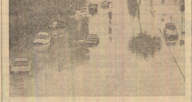
Ploile torențiale din ultimele zile au provocat inundații în regiuni din nordul Italiei. În fotografie: o suburbie din Milano inundată de apele revărsate ale riului Seveso

Luând cuvîntul în sesiunea Adunării Generale a O.N.U., care dezbate evoluția situației din Cipru, ministrul cipriot de externe, Ioannis Christophides, a cerut Națiunilor Unite să sprijine eforturile Ciprului de a rămîne stat suveran și independent, de a păstra integritatea teritorială a țării.