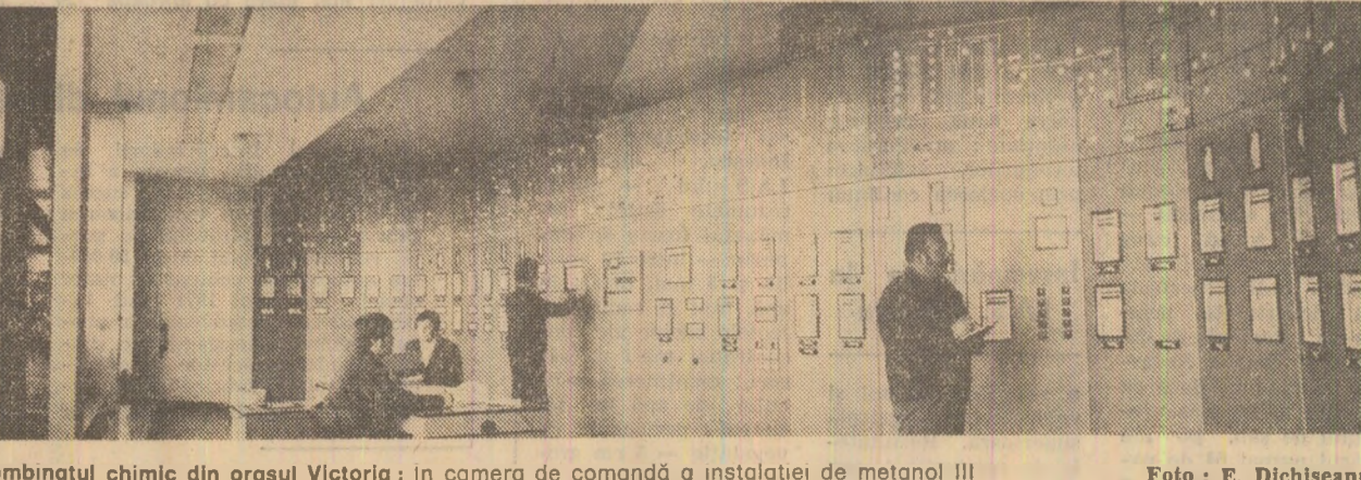
Combinatul chimic din orașul Victoria: în camera de comandă a instalației de metanol III

Prin autoutilare Combinatul de îngrășăminte chimice din municipiul Turnu Măgurele înregistrează în acest an însemnate succese în acțiunea de autoutilare. Astfel, în cadrul atelierului uzinal al combinatului au fost produse, de la începutul anului și pînă acum, peste 600 tone utilaje în valoare de circa 40 milioane lei. Totodată, au fost asimilate și introduse în fabricație, cu foarte propriu, mai bine de 400 repere, piese de schimb nestandardizate, reducîndu-se astfel importurile cu circa 14 milioane lei valută. De menționat este faptul că ponderea pieselor de schimb executate în atelierul uzinal propriu, din totalul necesar de piese, se ridică în acest an la 75 la sută, față de 59 la sută în 1975. (Ion Toader).