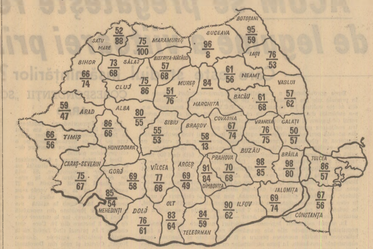
Stadiul recoltării porumbului la 9 noiembrie a.c. Cifrele reprezintă, în procente, suprafața de pe care s-a strîns recolta, în cooperativele agricole — sus și în întreprinderile agricole — jos

Timpu înaintat și starea vremii reclamă urgentarea lucrărilor de recoltare, transport și depozitare a recoltei de porumb. Din datele centralizate la ministerul de resort rezultă că pînă marți, 9 noiembrie, porumbul a fost strîns de pe 72 la sută din suprafețele cultivate. După cum se desprinde din cifrele înscrise pe harta alăturată, cooperativele agricole din județele Brașov, Botoșani, Suceava, Bacău ș.a. au posibilitatea să încheie în câteva zile această importantă lucrare.