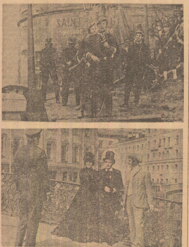
În program: 16 noiembrie: Spectacol de gală cu filmul „Jaroslaw Dabrowski”. 17 noiembrie: „Familia Dulscy”. 18 noiembrie: „Războiul meu, dragostea mea”.

Zilele filmului din Republica Populară Polonă se vor desfășura și în municipiile Timișoara (18-20 noiembrie) și Arad (19-21 noiembrie).