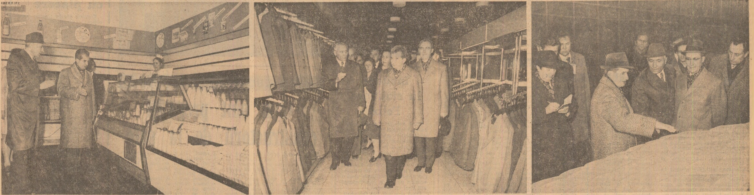
Momente din timpul vizitei la o unitate comercială de produse alimentare, la magazinul „Adam” și la expoziția de elemente de construcție