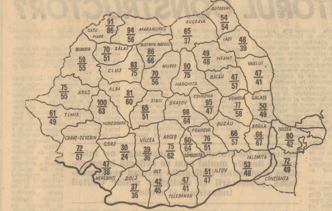
Stadiul arăturilor de toamnă la 19 noiembrie a.c. Cifrele reprezintă suprafețele arate, în procente, în cooperativele agricole (sus) și în, în întreprinderile agricole (jos).