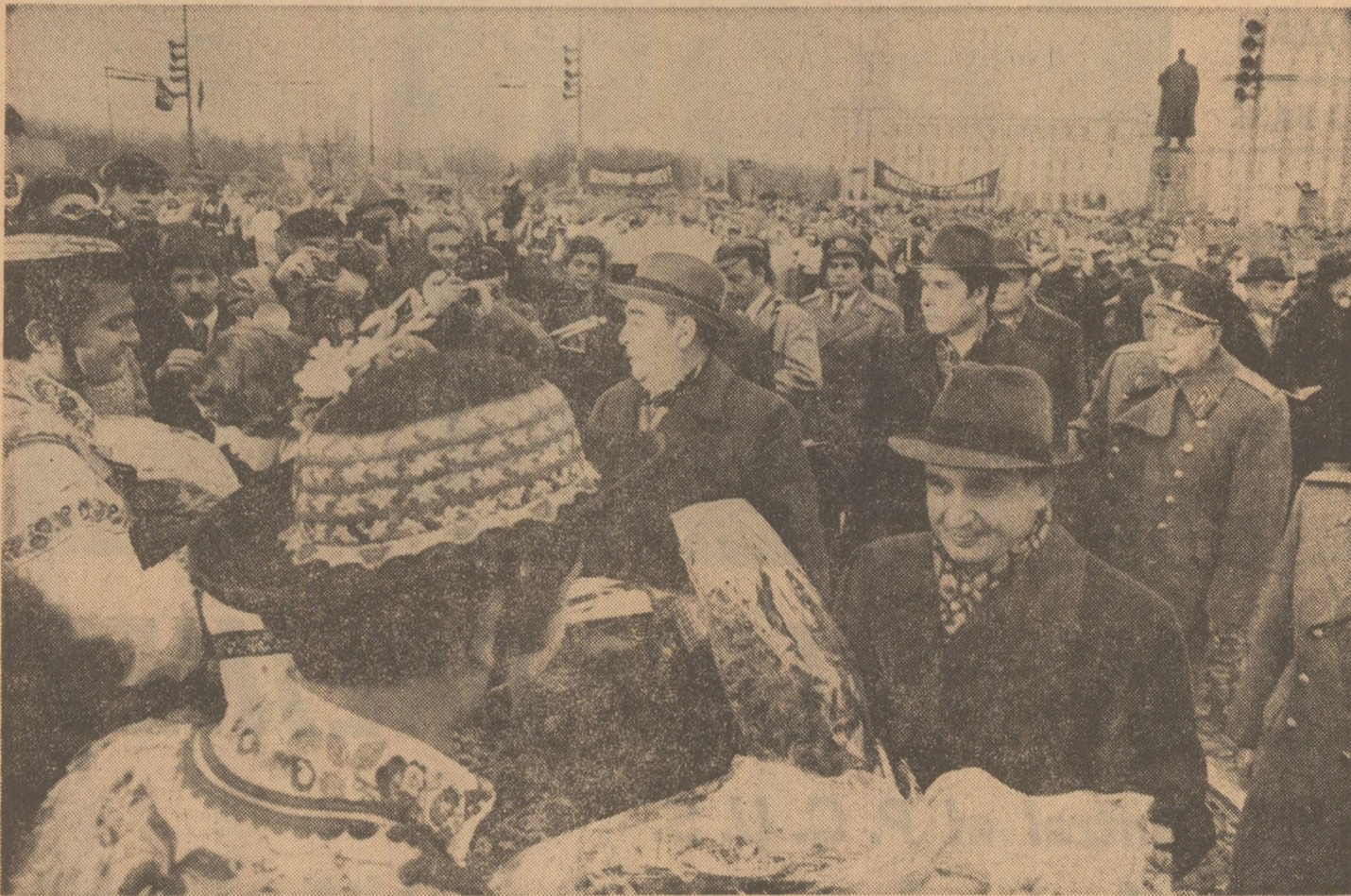
În semn de omagiu și înaltă prețuire, celor doi conducători de partid li se oferă buchete cu flori