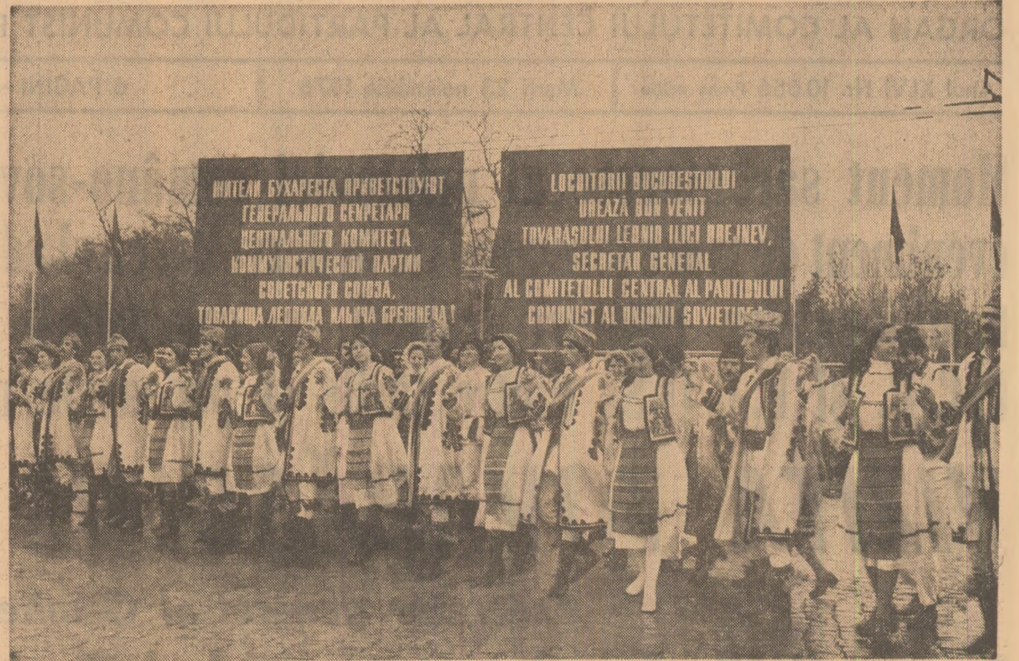
Sentimentele alese, de caldă prietenie sînt exprimate prin cîntece și dansuri