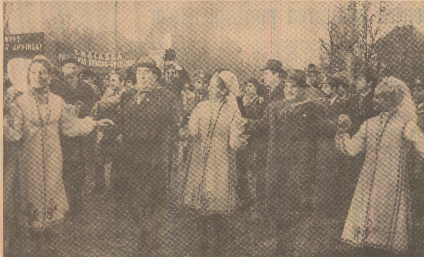
Hora prieteniei, imagine-simbol a prieteniei frățesti dintre popoarele român și sovietic