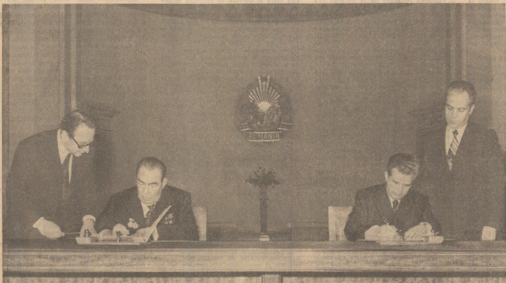
La solemnitatea semnării Declarației