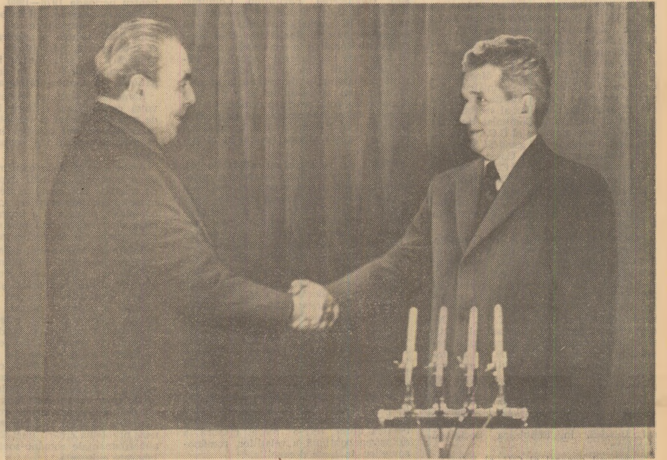
La mingul prieteniei româno-sovietice

Tovarășul Nicolae Ceaușescu, secretar general al Partidului Comunist Român, președintele Republicii Socialiste România, și tovarășul Leonid Ilici Brejnev, secretar general al Comitetului Central al Partidului Comunist al Uniunii Sovietice, au semnat, miercuri dimineața, la Palatul Consiliului de Stat, în cadrul unei ceremonii, Declarația privind dezvoltarea continuă a colaborării și prieteniei frățești între Partidul Comunist Român și Partidul Comunist al Uniunii Sovietice, între România și Uniunea Sovietică.