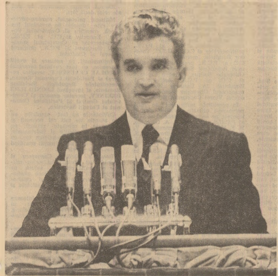
(Urmare din pag. 1)