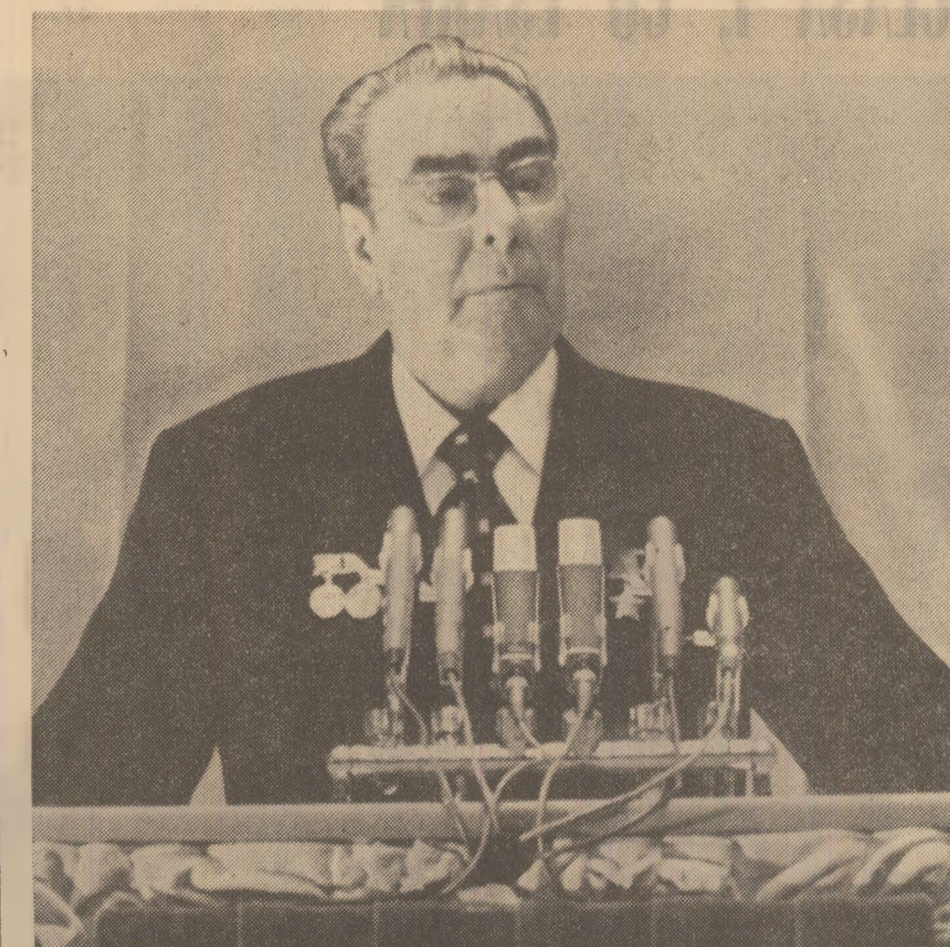
(Urmare din pag. 1)