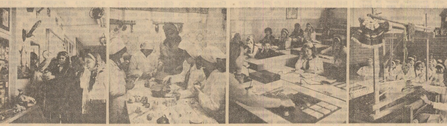
Argumente pe... peliculă ale integrării învățămîntului cu practica la una din școlile generale din orașul Victoria.

— Cînd și-au dat seama cooperatorii din Cotești că jumătatea lor de măsură nu le-a adus folosese? — Toamna, bineînțeles. Din păcate, unii află pragul doar cu prețul cucuului. Acum, la Cotești sînt modernizate poate cele mai mari suprafețe din rîndul cooperativelor județului. Am fost pe la începutul lui septembrie și am văzut. A rătat frumos. „Toate fermele o să le facem așa”, m-au încredințat câțiva șefi de echipă. „De ce nu le-ai făcut pînă acum?” „Ei, parcă dv. nu știți cum e omul...” — Și cum e omul, tovarășă Dușchin? — Nelimitat în puterea, în inițiativă, în gîndirea lui. El este cel care naște și hotărăște soarta unei idei. El e cel care schimbă, întinerește tot ceea ce ne înconjoară. De el depinde mai binele de azi și cel de mâine. Iată de ce, uneori, sînt foarte mișcîți cînd mai întîlnesc cîte un coleg, inginer, aflat la post în cooperativa agricolă de producție și care nu se înha-