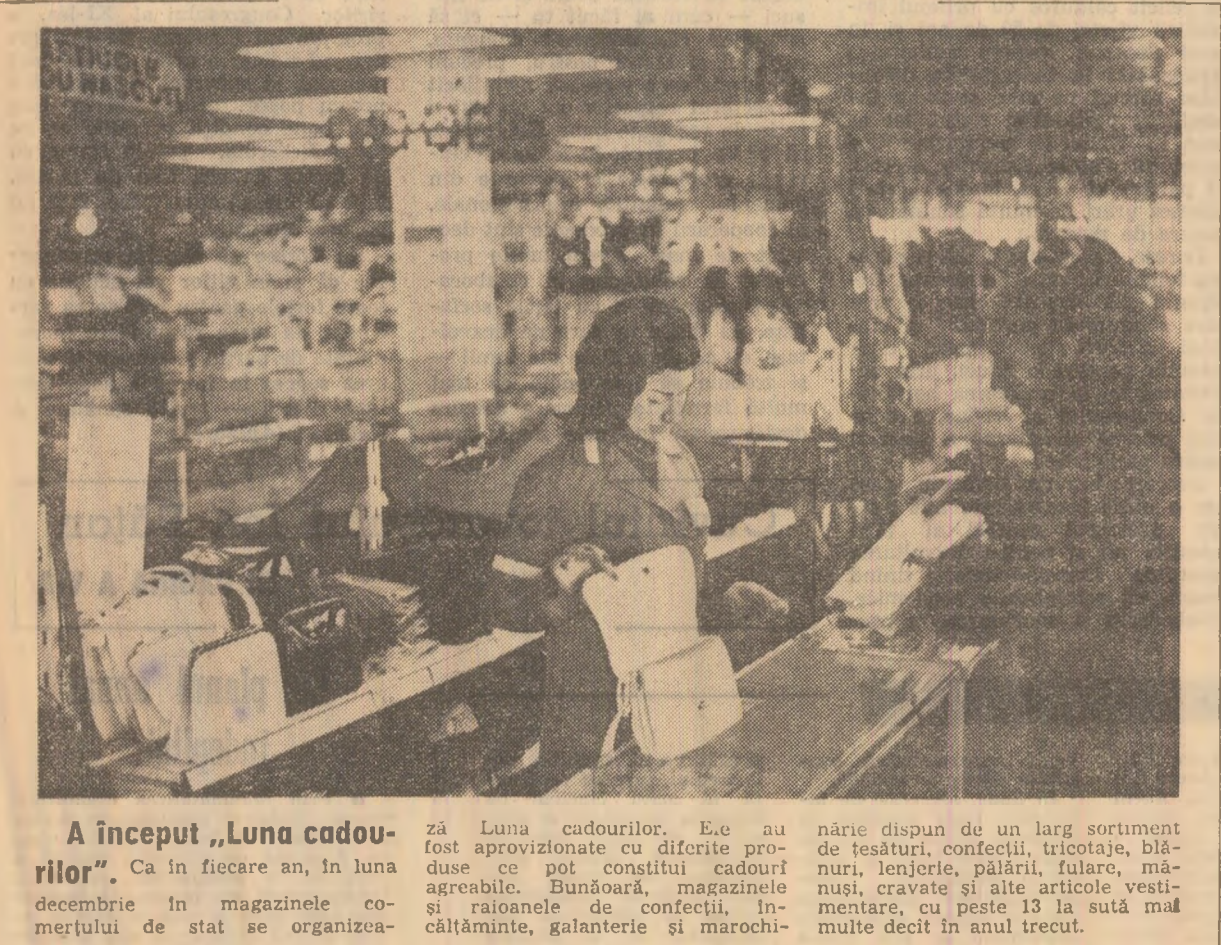
A început „Luna cadourilor”. Ca în fiecare an, în luna decembrie în magazinele comerțului de stat se organiza-