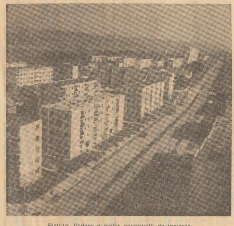
Bistrița. Vedere a noilor construcții de locuințe