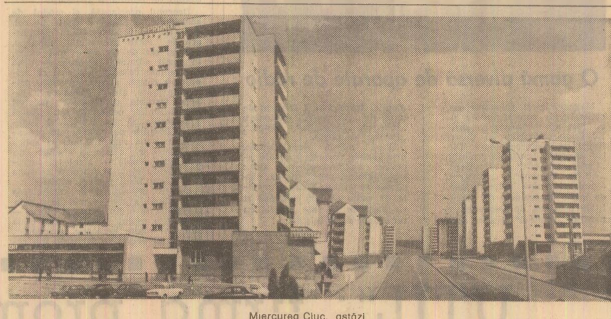
Miercurea Ciuc, astăzi