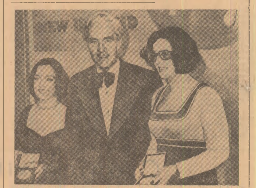
„Mișcarea pentru pace a femeilor din Irlanda de Nord” intrunește largă aderență a opiniei publice din țară și de peste hotare. In imagine: Betty Williams și Mairead Corrigan...