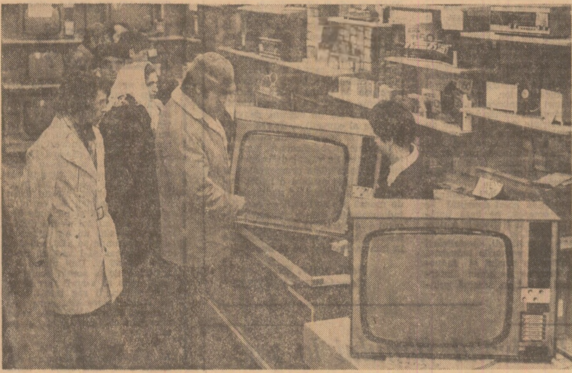
Producția de televizoare românești este în plină dezvoltare. Se fabrică receptoare multicanal, cu o mare stabilitate în funcționare, care asigură o imagine și un sunet de calitate. În "magazinele" și raioanele de specialitate ale comerțului de stat se găsesc în prezent televizoare cu diagonală ecranului între 31 și 65 cm. Iată și câteva din mărcile acestor aparate: „Sport”, „Venus”, „Compliment”, „Opera”, „Clasic”, „Diamond”, „Lux”. Aceste receptoare, al căror preț este între 2.870 și 3.960 lei, pot fi procurate din comerțul de stat și cu plata în 24 rate lunare.