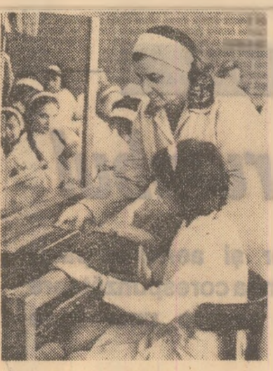
„Miini indemnitate” la școala generală din Orașul Victoria