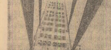
O realizare remarcabilă a constructorilor sovietici: la Kiev a fost ridicat peste apele Niprului un pod-monolit, in lungime de 300 de metri. Terminat cu o lună inainte de termen, noul pod face legătura între cele mai populate cartiere ale orașului. In imagine: autocamioane de mare capacitate, umplute pînă la refuz, in timpul probelor de rezistență a construcției

Aminare. Negocierile între Washington și Manila, privind menținerea bazelor americane in Filipine, au fost suspendate pînă la 20 ianuarie anul viitor, a anunțat Departamentul de Stat.