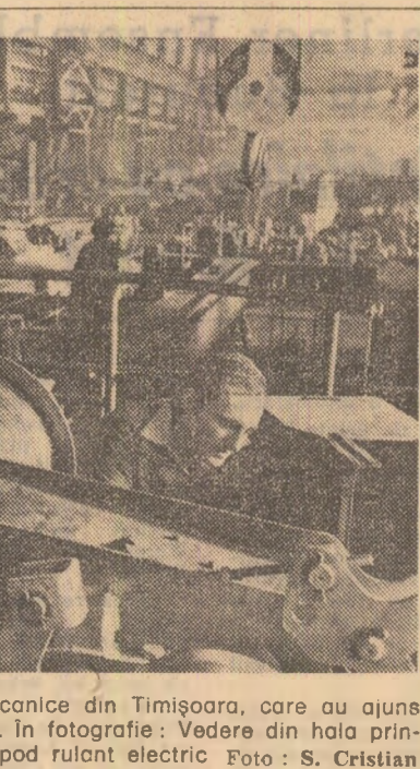
Calitatea și funcționalitatea ridicate caracterizează produsele întreprinderii mecanice din Timișoara...