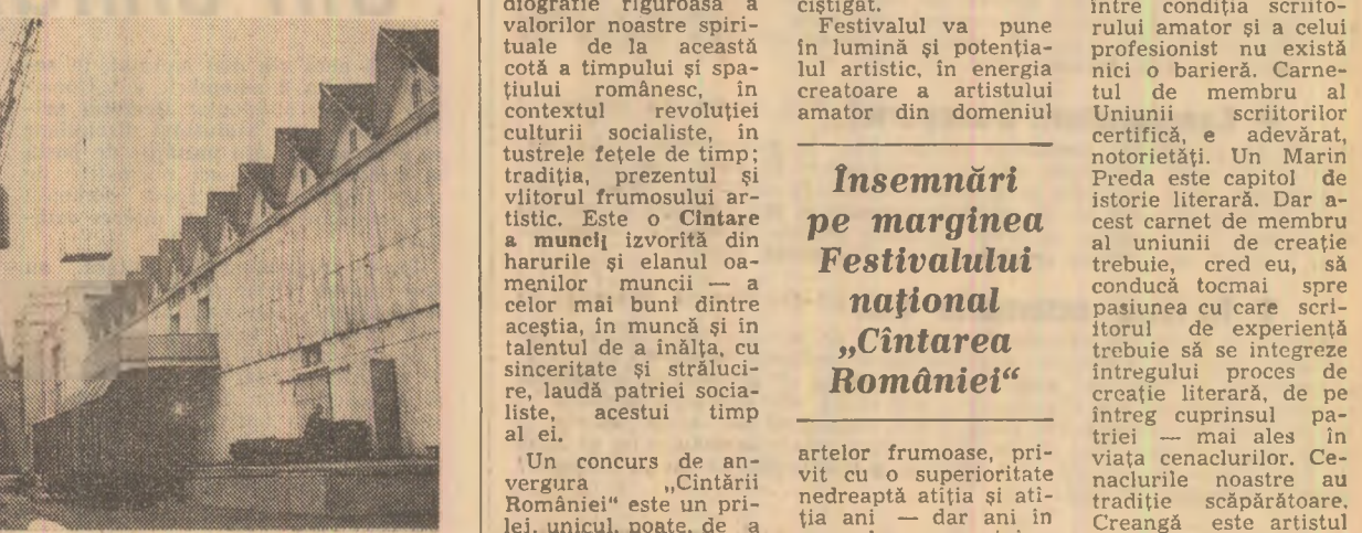
„Fereastră spre lume” — portul Constanța, în permanență deschis, cunoaște o activitate febrilă.

ta, la noi, e adevărat, și o asemenea scoală ce-și propunea să „facă” scriitorii și care a reușit să creeze o creație literară, de pe breaslă, dar din care, cum spunea Sadoveanu la festivitatea de încheiere a anului școlar, au ieșit scriitorii numai aceia care au intrat scriitori. Or, tocmai datorită acestei incertitudini, a acestei lipse de atestată oficial, între condiția scriitorului amator și a celui profesionist nu există nici o barieră. Carnetul de membru al Uniunii scriitorilor certifica și adevărat, notorietăți. Un Marin Preda este capitol de istorie literară. Dar acest carnet de membru al uniunii de creație trebuie să conducă tocmai spre pastunarea cu care scriitorul de experiență trebuie să se integreze într-un proces de creație literară, de pe întreg cuprinsul patriei — mai ales în viața cîntărilor. Cevăzuri cu o superioară nedreaptă atîția și atîția ani — dar ani în care el muncea și împodobește peretii caselor de cultură, dădea pietrele metalului și anului forme armonioase. Astăzi, după numai cîțiva ani de încurajare a acestui nobil efort, ne dăm seama că unii artiști amatori au eșuat cu succes în saloane pretențioase din țară și de peste hotare, contribuind substanțial la prestigiul artei noastre naționale.