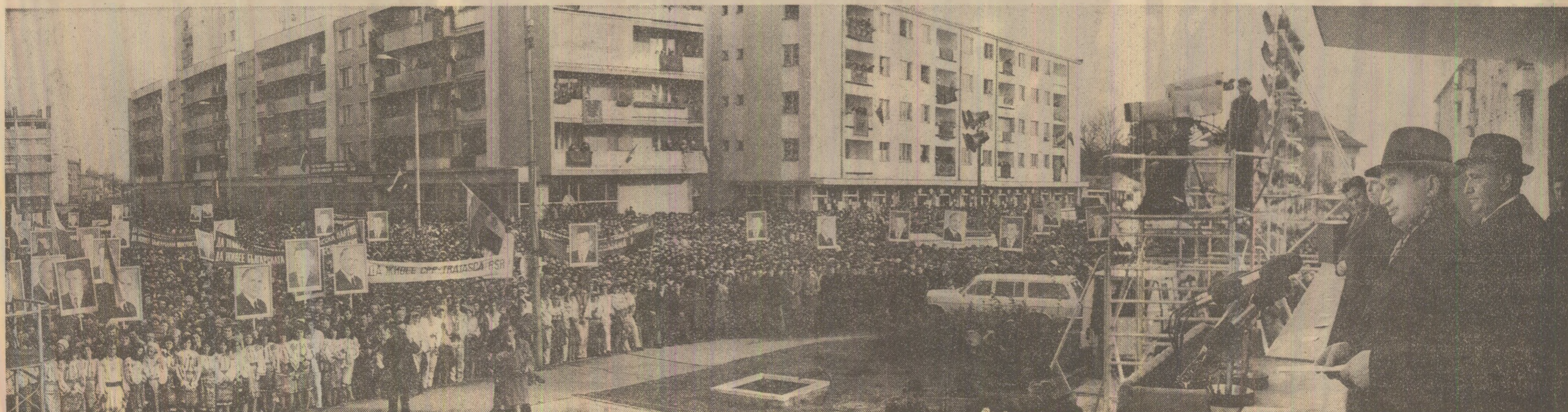
Aspect din timpul însușeștului miting de la Giurgiu