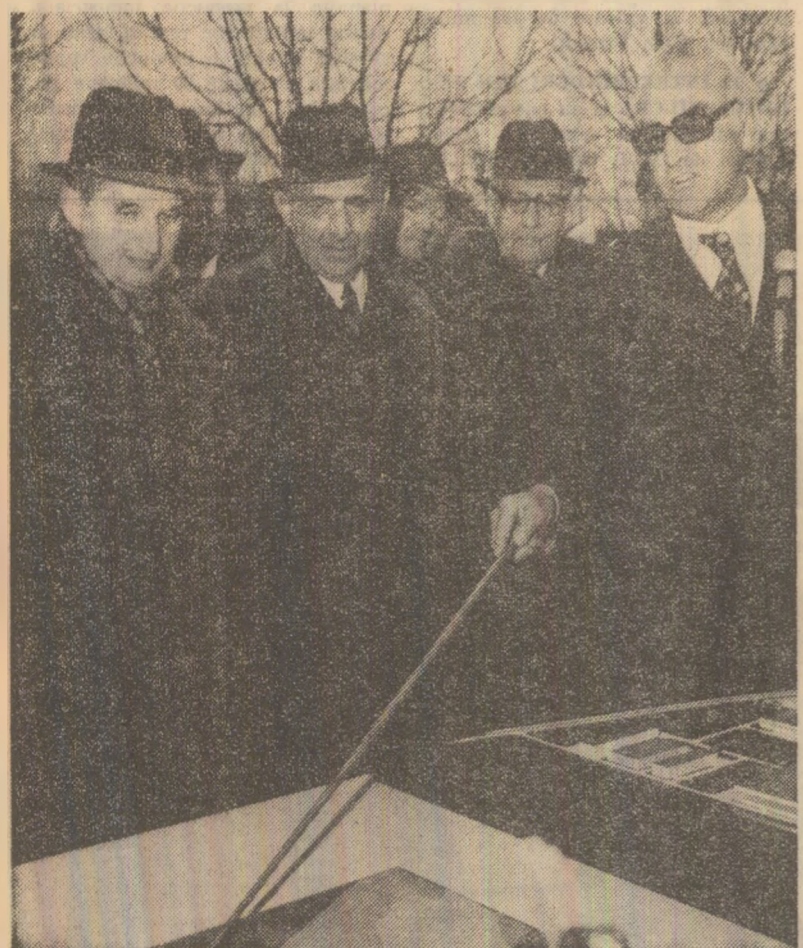
În fața machetei viitoarei întreprinderi