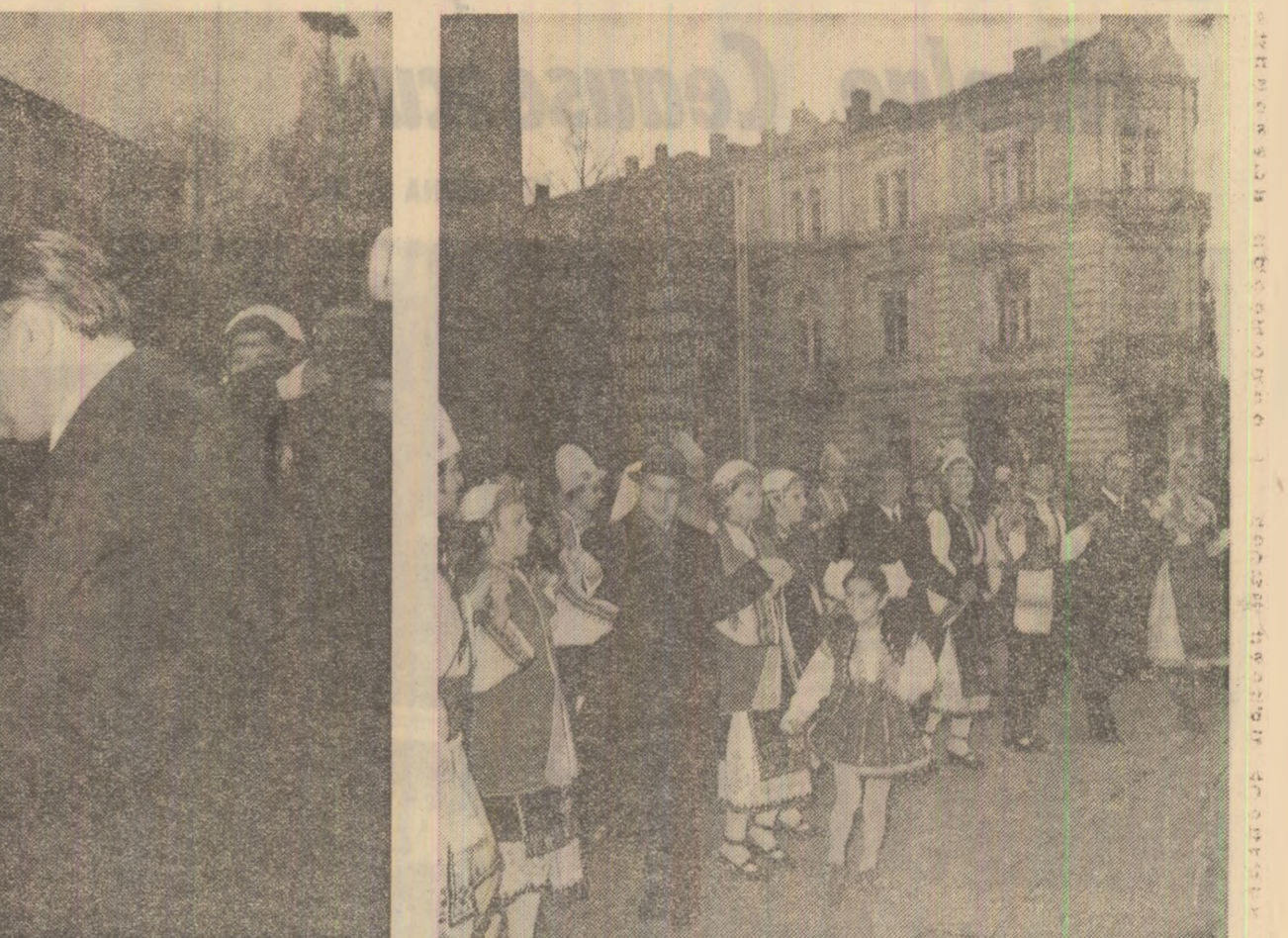
Moment semnificativ pentru amsosiera sărbătorească — hora prieteniei și frăției româno-bulgare