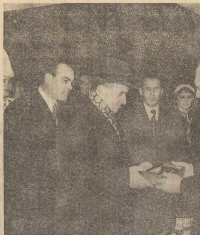
În semn de înaltă stimă și respect, tovarășului Nicolae Ceaușescu i se înmănează, la Ruse, cheia orașului