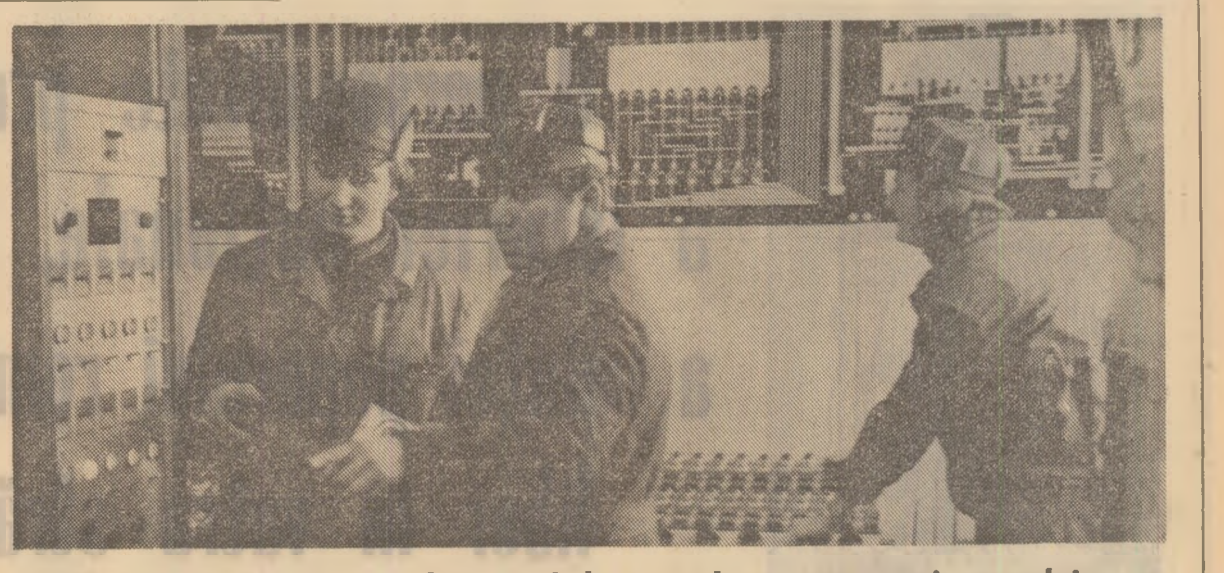
SIBIU: o nouă și modernă fabrică de nutrețuri combinate

O mare parte din furajele necesare zootehniei județului Sibiu, ca și unor unități cooperatiste și de stat din județele apropiate este asigurată de noua și modernă fabrică de nutrețuri combinate din Sibiu. Respectiv, grație graficelor de livrare a materiei