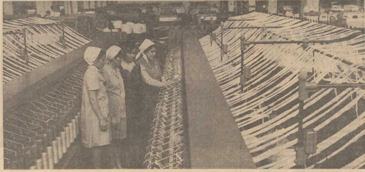
Intr-una din noile hale ale întreprinderii textile „Moldova” din Botoșani