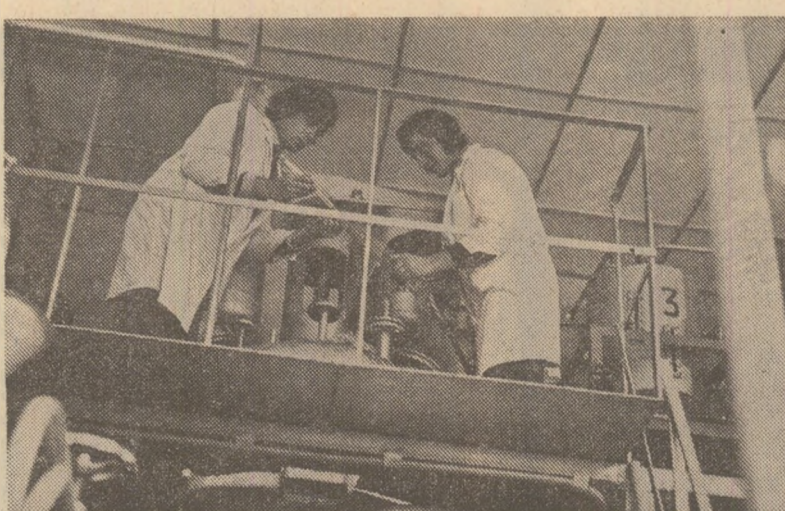
Institutul român de cercetări marine-Constanța: în laboratoare se studiază probleme actuale legate de lupta împotriva poluării

O mare eficiență în munca de instruire-educare o are folosirea metodei care îl ajută pe tînr să-și formeze o imagine globală, unitară, asupra mediului, scoțîndu-se în relief caracterul de sistem al relațiilor om-natură-tehnică, ale cărui subsisteme și componente se intercondiționează reciproc.