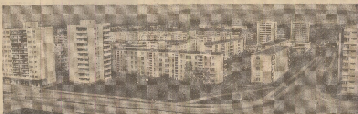
Ilustrată din Sibiu