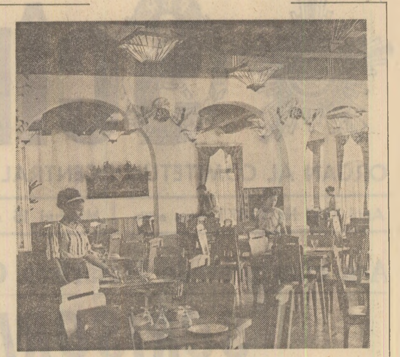
La Oficiul județean de turism-lăși

de conducere față de problemele sesizate, față de părerile critice venite din masă, să se dezbătă în adunările generale, în colectivele de muncă, concluziile rezultate din cercetarea sesizărilor cu conținut mai important, în vederea dezvoltării opiniei de masă împotriva manifestărilor ce contravin disciplinei de partid și de stat, obligațiilor profesionale, normelor de conviețuire în familie și societate. Este necesar să se înțeleagă că intrarea în vigoare a hotărîrilor trebuie să fie imediată, să nu se admită nici un fel de tergiversări ori să se aștepte semnale deosebite pentru a se trece la îndeplinirea măsurilor prevăzute. Aceasta impune ca hotărîrile să i se acorde atenția cuvenită. Urmărirea permanentă a modului