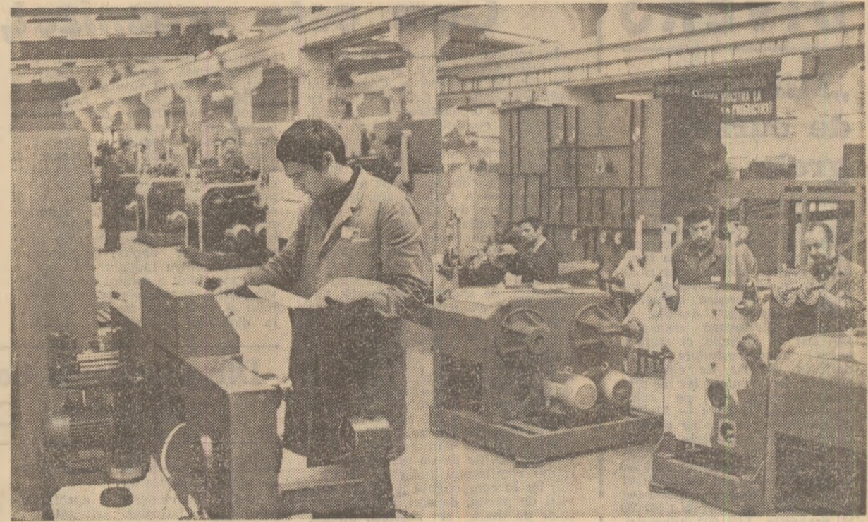
„Electrotimis” se prezintă prin oamenii săi harnici și produsele de calitate realizate aici