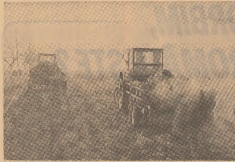
toate tractoarele să fie folosite cu randament sporit. În unitățile din Lunca Dunării se lucrează cu forță sporită mai ales pe terenurile nisipoase, care permit efectuarea unor arături de bună calitate. (Virgiliu Tătaru).

motopompiștilor pentru a forma două schimburi pe tractoare. De asemenea, s-a stabilit să se urgenteze eliberarea terenului de resturi vegetale pentru a crea front de lucru tractoarelor. Sint măsuri care vor duce la creșterea ritmului la arat. (Emilian Rouă).