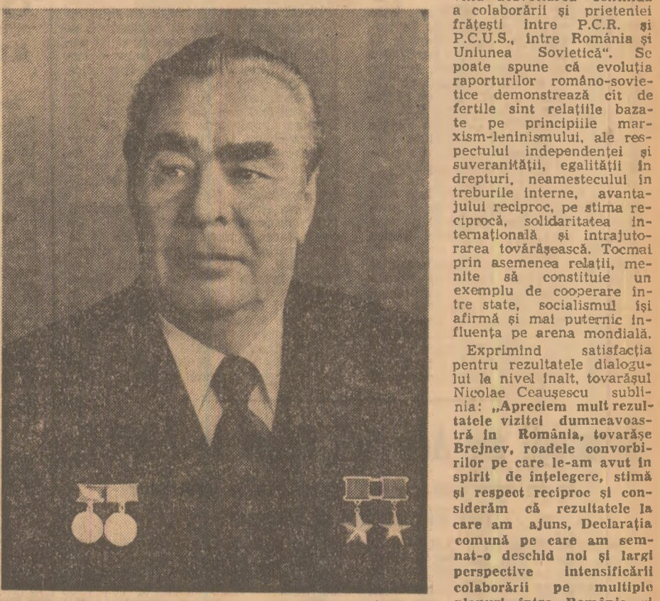
Tovarășul Leonid Ilici Brejnev

Săptămîna care se încheie a fost marcată, ca și cele precedente, de numeroase fapte și acțiuni care ilustrează activitatea intensă desfășurată de partidul și statul nostru pe plan internațional, în concordanță cu orientările și principiile stabilite de Congresul al XI-lea. Preocuparea pentru adîncirea relațiilor cu toate statele socialiste — constantă esențială a politicii noastre externe — se materializează în amplificarea schimburilor de delegații, a contactelor reciproce, a inițiativelor prietenești. În acest context se înscrie plecarea tovarășului Nicolae Ceaușescu la Moscova, cu