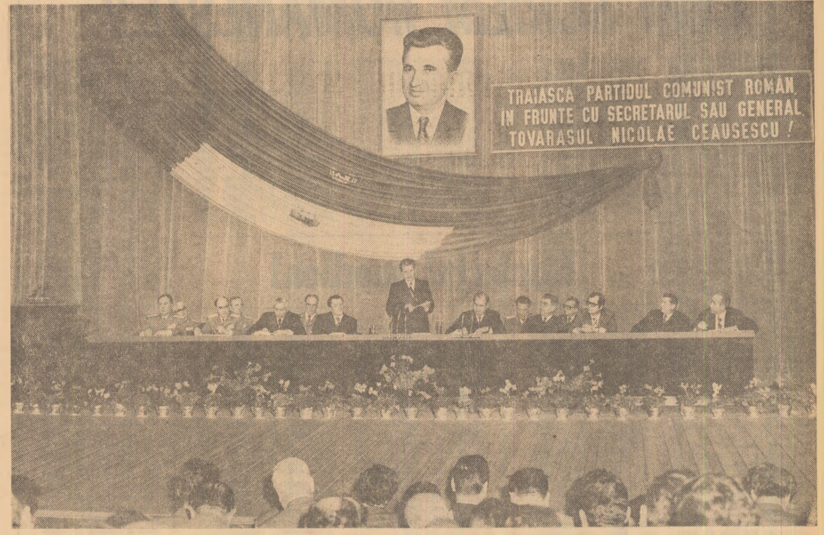
TRAIASCA PARTIULUI COMUNIST ROMAN IN FRUNTE CU SECRETARUL SAU GENERAL TOVARASUL NICOLAE CEAUSESCU ?

La de ce activitatea organelor de interne, ca organe de partid și de stat, trebuie să se desfășoare tot mai mult în strânsă legătură cu masele largi populare. În activitatea lor trebuie să se înceteze neapărat de a apela la masele largi populare, de a organiza regulat adunări pentru dezbateri, infracțiunilor. Trebuie să asigurăm ca toți cei ce muncesc în patria noastră să participe activ la apărarea cuceririlor revoluționare, a proprietății obștești, la afirmarea în practică a principiilor etici și