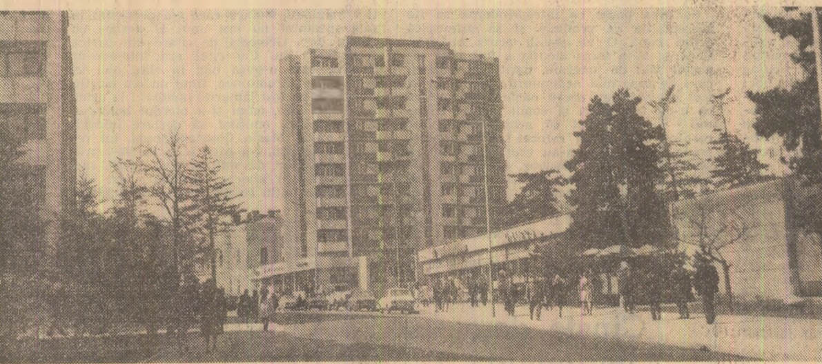
Peisaj în Botoșanii de azi