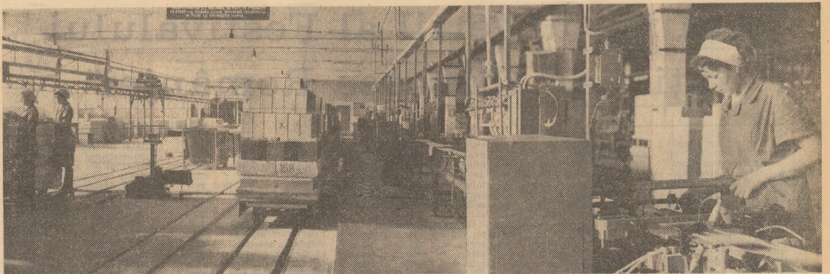
Olăritul de altădată a căpătai, la Lugoj, o replică industrială modernă: întreprinderea de produse ceramice. În fotografie: aspect din secția glazurării-fornaj