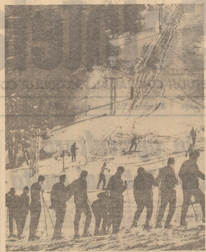
La schi, pe piriile de pe Postăvarul.

La recensământ, toate femeile născute înainte de anul 1962 vor trebui să declare numărul copiilor născuți vii pînă la ora zero din noaptea de 4 spre 5 ianuarie, indiferent dacă la data înregistrării acestia mai sînt, sau nu. Într-un caz, dacă femeia a parat a înregistra numărul de copii născuți vii se scootese toți copiii proveniți din căsătorie actuală sau anterioară și din afara căsătoriei, indiferent dacă se află sau nu în gospodăria părintilor.