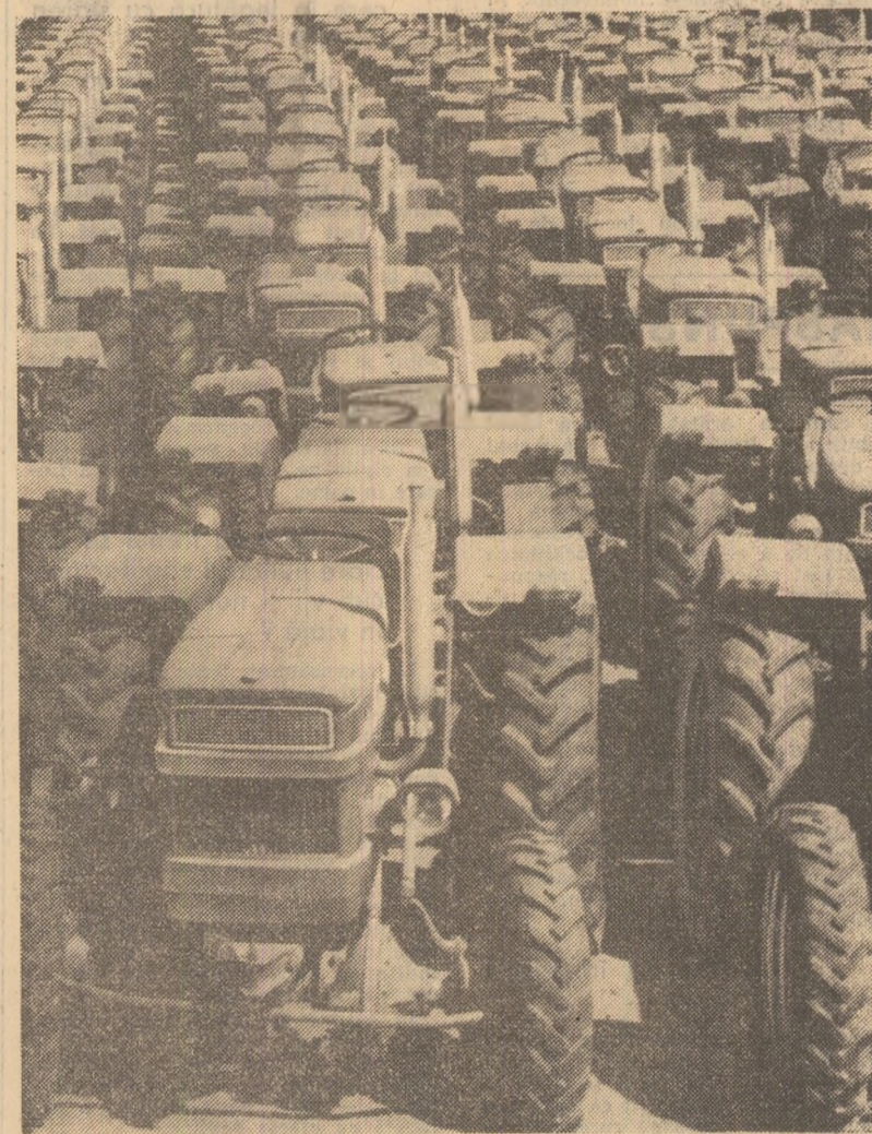
Brașov: un nou lot de tractoare este gata pentru livrare