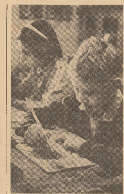
În zilele vacanței, la Casa pionierilor din orașul Bistrița (cerul artelor plastice)

Este însă momentul să ne gîndim în prezent și mai cu seamă la viitor, pentru