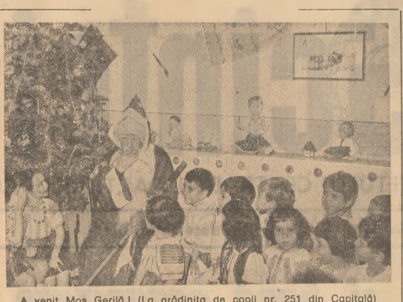
A venit Moș Gerilă! (La grădinița de copii nr. 251 din Capitală)