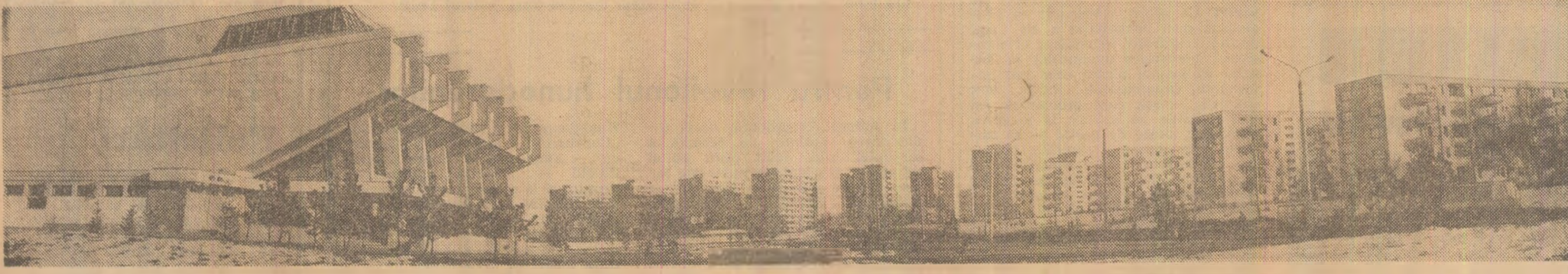
Peisaj din Brașovul de azi

Radu SELEJAN (Continuare în pag. a IV-a)