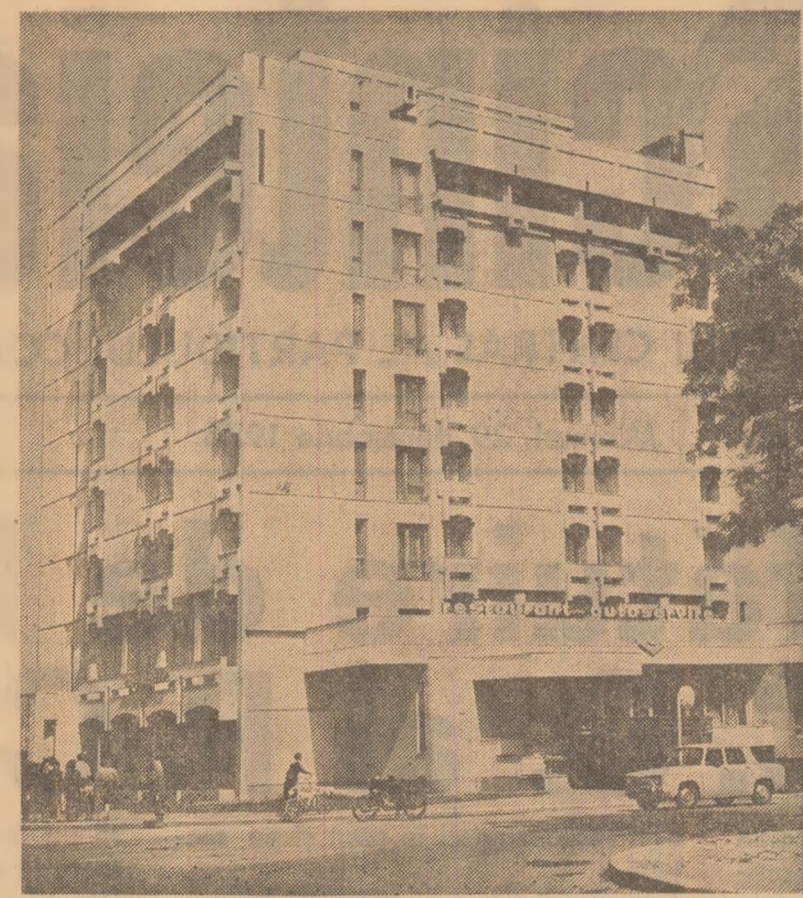
Modernă clădire a hotelului „Pietroasa” din Buzău