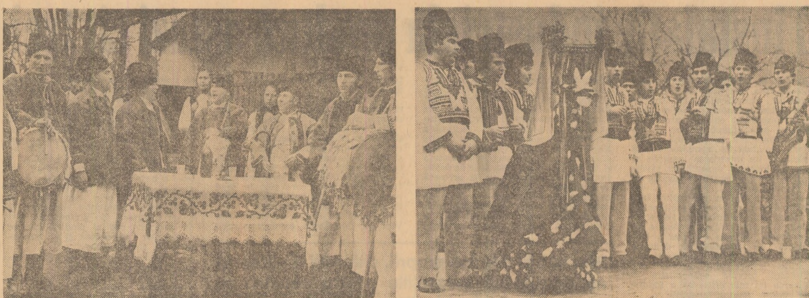
Spectacole tradiționale sărbătorilor de iarnă în comunele Hotar, județul Bihor (stînga), și Ajei, județul Sibiu (dreapta)

Concomitent cu preocuparea pentru calitatea manifestărilor artistice și a spectacolelor prezentate în cadrul festivalului, o grijă deosebită se acordă permanentizării acestora, așa în-