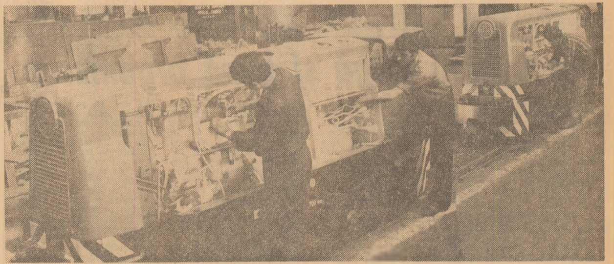
Întreprinderea „Unio” din Satu Mare: se lucrează la montajul unui nou lot de locomotive de mînd

Nicolae MOCANU correspondentul „Scintell”