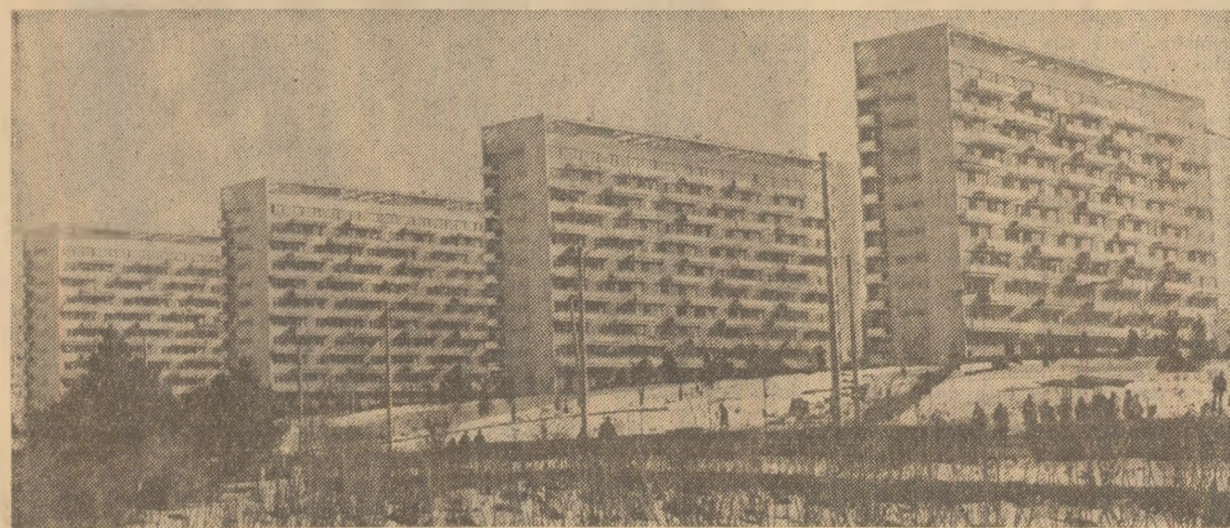
Cluj-Napoca: o nouă geometrie arhitecturală se înscrie în ansamblul vechilor construcții din bătrînul oraș

Rubricile noastre: FAPTUL DIVERS; CARTEA; SPORT; DIN ȚĂRILE SOCIALISTE; RĂSFIND PRESA STRAINĂ; DE PRETUTINDENI