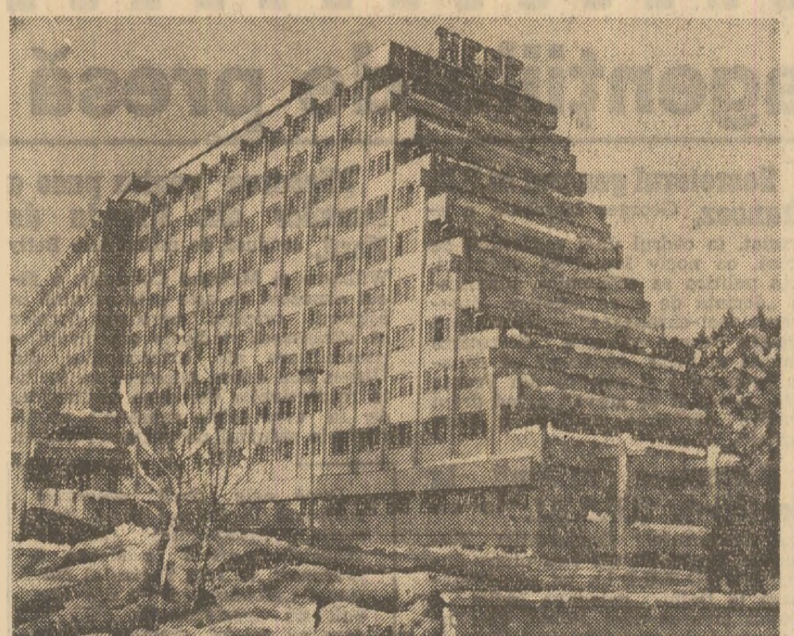
La plecare, pe aeroportul Otopeni, oaspetii au fost salutati de tovarășii: Emil Bobu, membru al Comitetului Politic Executiv...

14.05 Telex. 14.10 Turism și vinătoare. 14.35 Retrospectivă: Patinaj artistic 1976 (V).