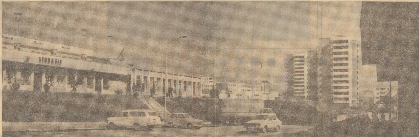
Înnoiri edilitare, construcții moderne la Sf. George

În plin centrul municipiului Dej a fost dat recent în folosință un hotel turistic cu 130 de locuri, cu restaurant, braserie, sală de mic dejun și un bar de zi. În afară de acesta, cartierul Dealul Florilor s-a îmbogățit cu încă 340 de apartamente. Este gata a fi dată în folosință o nouă policlinică, iar spitalul cu 430 de paturi este în finisaje avansate. Se află în construcție și un dispensar în cartierul Dealul Florilor. A început să funcționeze, zilele acestea, și stația biologică care va trata apele reziduale provenite din surse industriale, înainte de a reintra în albia Someșului Mare. Se lucrează în continuare la îndiguierea malului Someșului și a văii Salca, în vederea prevenirii inundațiilor. Populația municipiului Dej, îndebesbi tineretului, a executat în anul trecut un mare volum de muncă patriotică la îndigui, canale de scurgere, construcții de drumuri, amenajări de spații verzi. Valoarea muncii patriotice se ridică la 2.158 lei de fiecare locuitor al municipiului. În acest an, în municipiul Dej se vor mai construi încă 350 de apartamente, un liceu cu internat și alte obiective social-culturale. (Al. Mureșan).