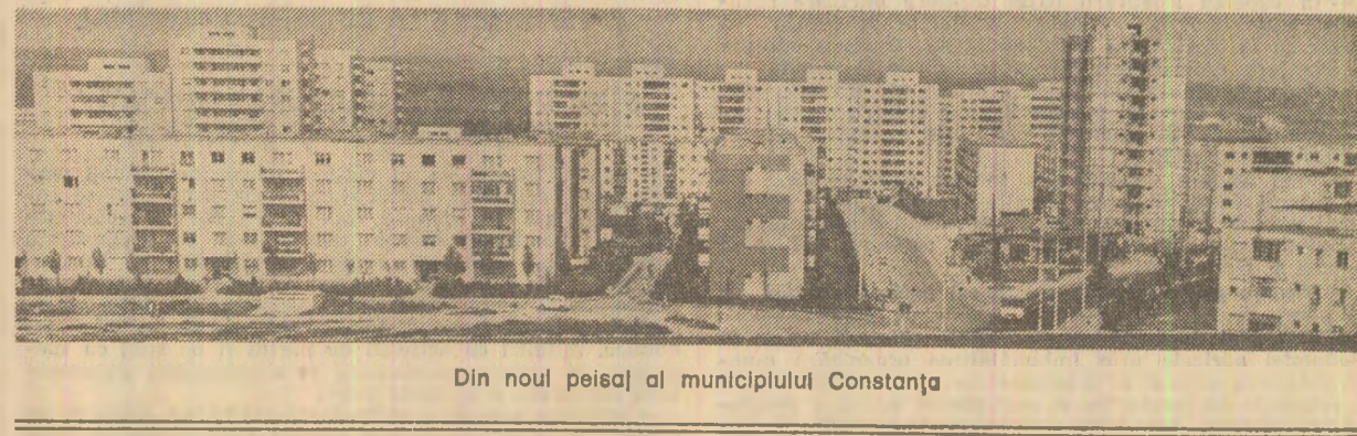
Din noul peisaj al municipiului Constanța