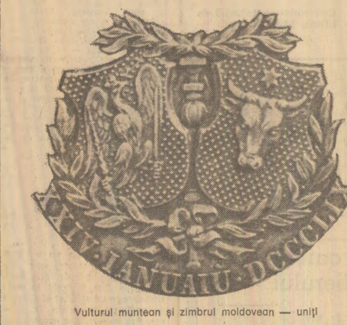
Vulturul muntean și zimbrul moldovean — uniți