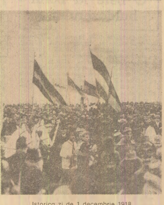
Istorică zi de 1 decembrie 1918