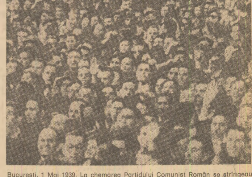
București, 1 Mai 1939. La chemarea Partidului Comunist Român se strîngeau rîndurile forțelor ce luptau pentru apărarea independenței și unității României

Scrisoare a C.C. al P.C.R., noiembrie 1935