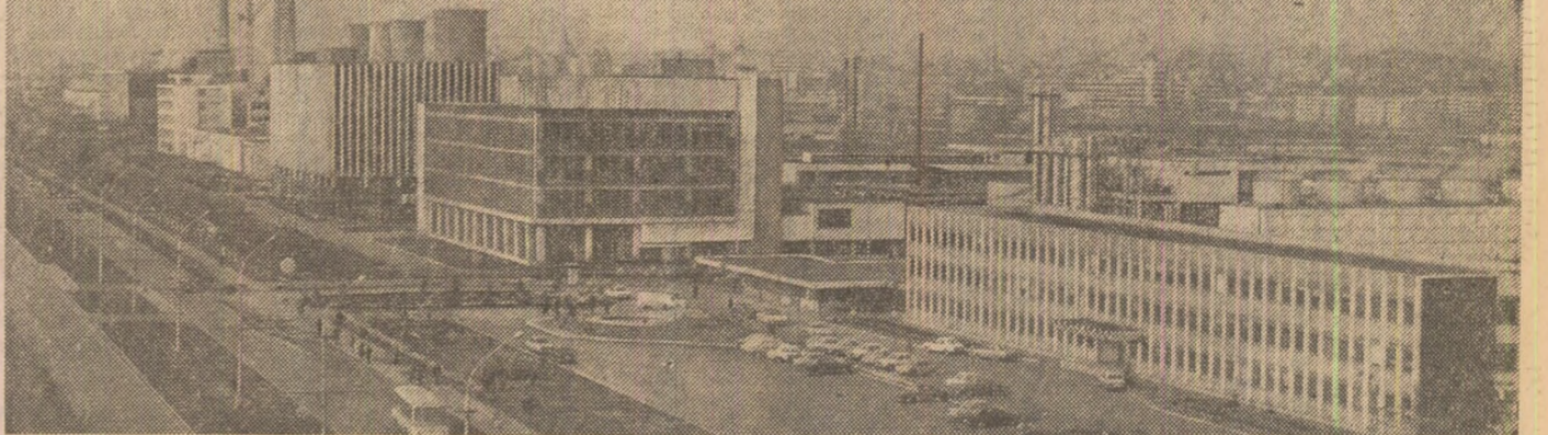
Pe întreg cuprînsul țării, industria socialistă este temel de civilizație și progres. În fotografie: platforma industrială a loșului

Un puternic liant al unității poporului îl constituie narea și generalizarea ideologiei socialismului și științelor dominante în România. Unitatea moral-politică a poporului se întărește prin: • dezvoltarea continuă a conștiinței socialiste a oamenilor muncii, o deosebită însemnătate avînd în această privință a Planului Programului de măsuri în domeniul activității politice, culturale și educative. • înfăptuirea la scară întregii societăți a principiilor și normelor Codului eticii și echității socialiste.