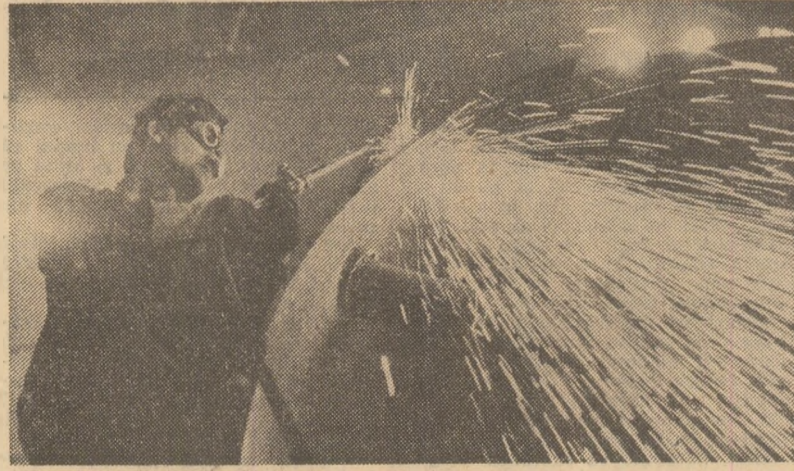
Aspect de muncă în secția cazangerie grea de la întreprinderea bucureșteană „Grivița roșie”