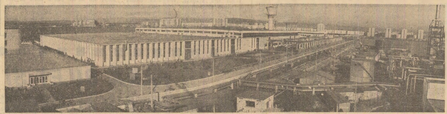
Tindra „cetate” a industriei țigovenice — întreprinderea de strunguri „SARO”