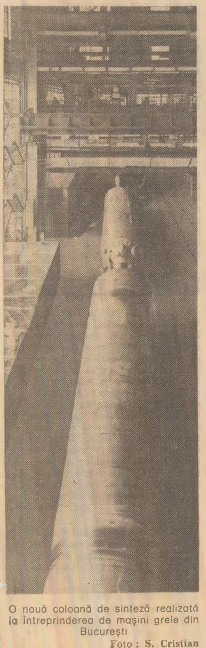
O nouă coloană de sinteză realizată la întreprinderea de mașini grele din București.

Mihai IONESCU (Continuare în pag. a III-a)