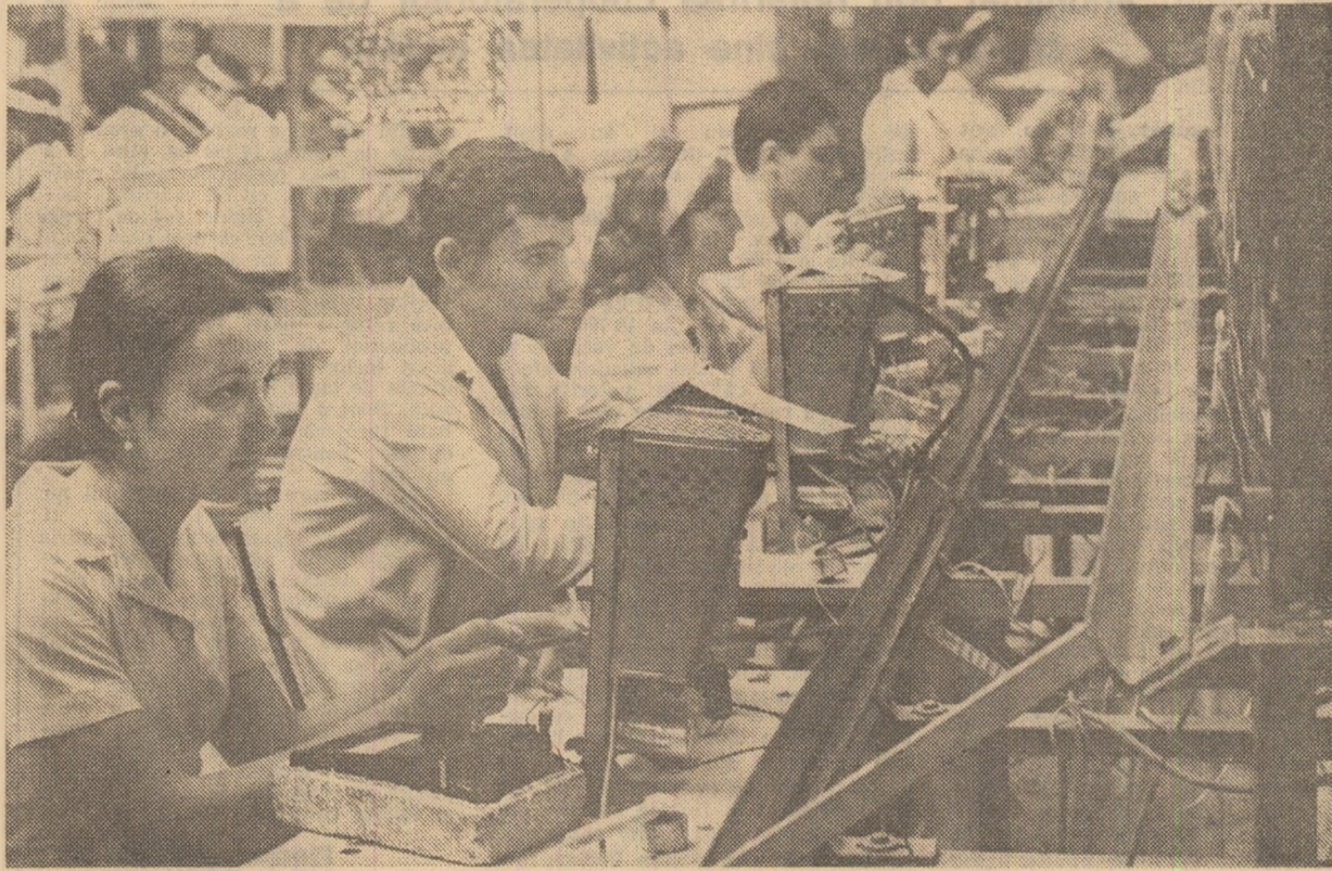
Tineri muncitori dintr-o mare întreprindere: „Electronica” din Capitală

Cu acest prilej, tovarășul Nicolae CEAUȘESCU a acordat publicistului francez un interviu.