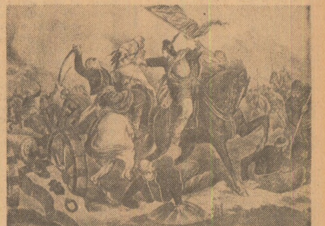
CĂLUGĂRENI 1895: Condușă și insultată de Mihail Viteazul, oastea română a reușit să obțină la Calugăreni o strălucită biruință — expresie a voinței poporului de a-și apăra libertatea

Ideea neatîrnării în gîndirea social-politică înaintată