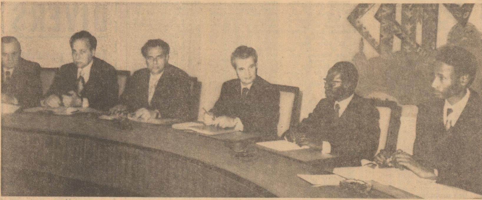
Aspect de la convorbirile oficiale