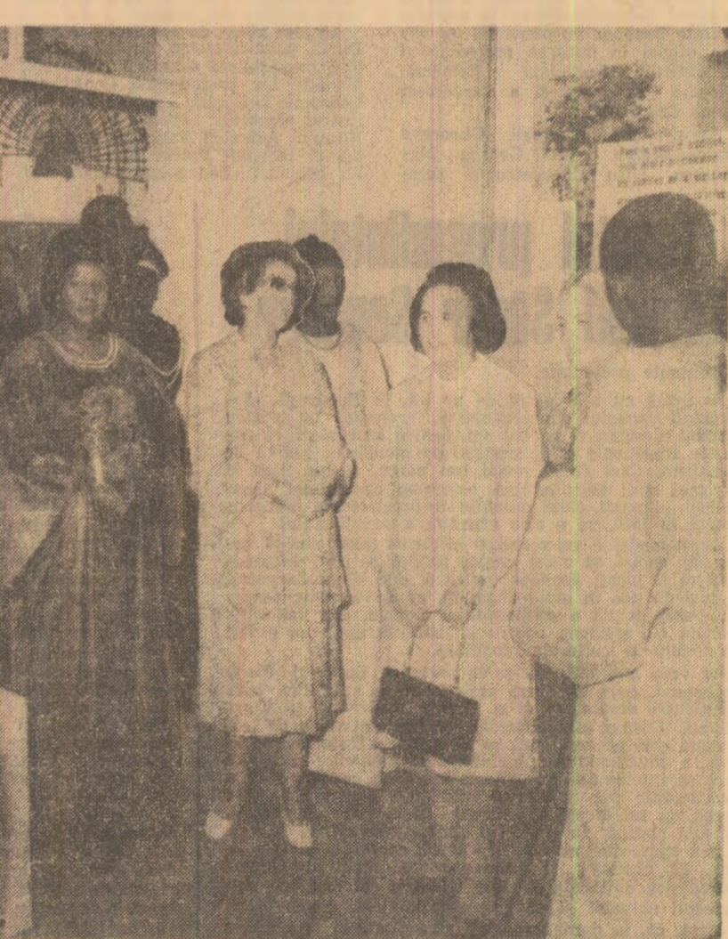
În sala muzeului din capitala Senegalului

Programul, cuprinzînd creații reprezentative din folclorul senegalez, a impresionat prin sensibilitate și fantezie, prin autenticitate, prin nobletea mesajului transmis. Multe dintre piesele coregrafice și muzicale interpretate sînt inspirate din epopeea națională senegaleză, de luptă pentru independență, de aspirațiile senegalezilor spre progres, bunăstare, civilizație. Ele relevă capacitatea creatoare ale poporului Republicii Senegal, dragostea și luminosa pentru frumos, vitalitatea folclorului senegalez.