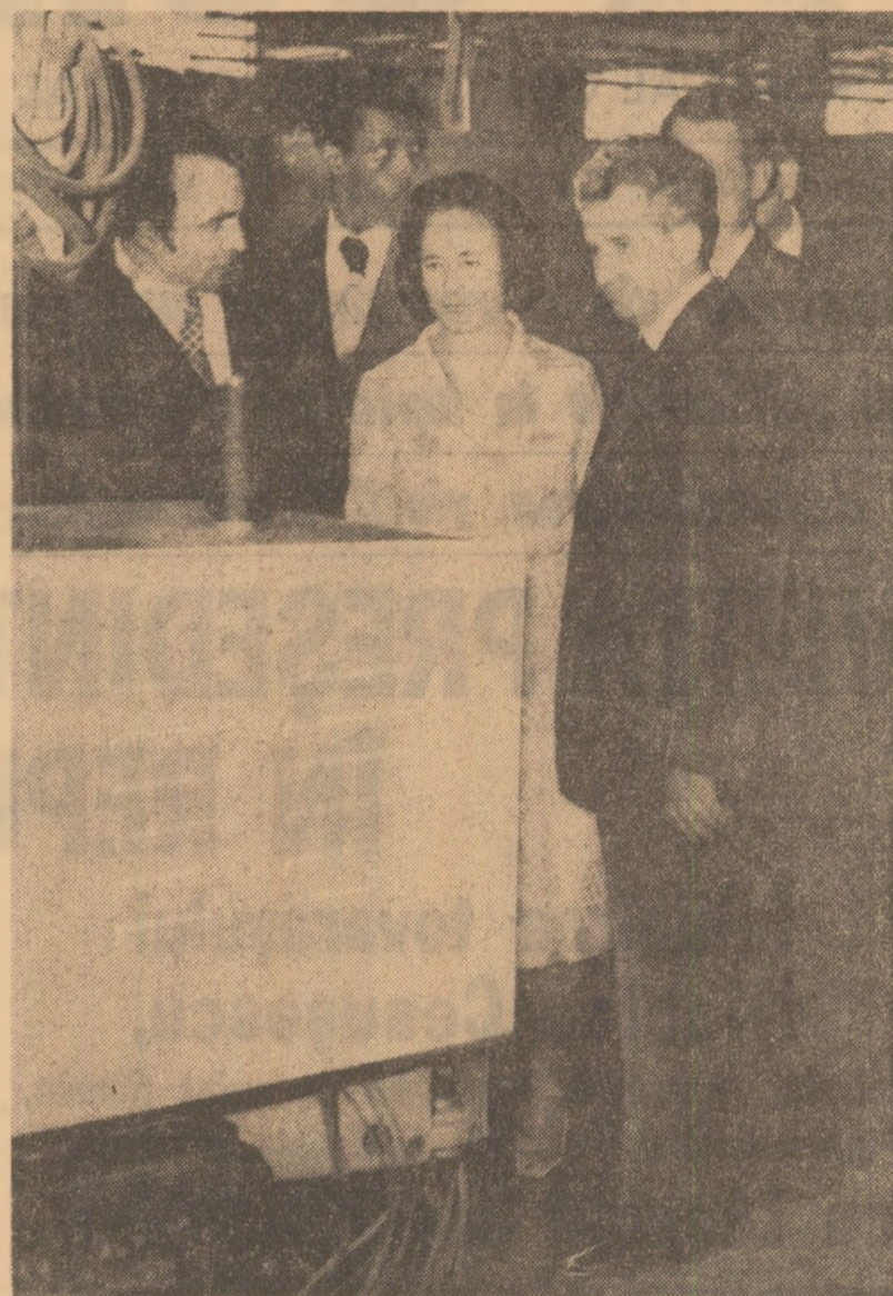
În timpul vizitei la întreprinderea de confecții

Înainte de a părăsi întreprinderea, tovarășul Nicolae Ceaușescu și tovarăsa Elena Ceaușescu au scris următoarele în cartea de onoare: „Ne-a făcut multă plăcere să ne întâlnim cu harnicul colectiv al Societății pentru industria de îmbrăcăminte. Felicităm cu căldură pe muncitorii și tehnicienii întreprinderii pentru realizările obținute și le urăm din inimă noi și mari succese în întreaga lor activitate, în dezvoltarea industriei naționale senegaleze”. Colona de mașini oficiale s-a îndreptat apoi spre reședința prezidențială, în aclamațiile multimei adunate pe străzile din jurul întreprinderii, ca și pe întregul traseu.