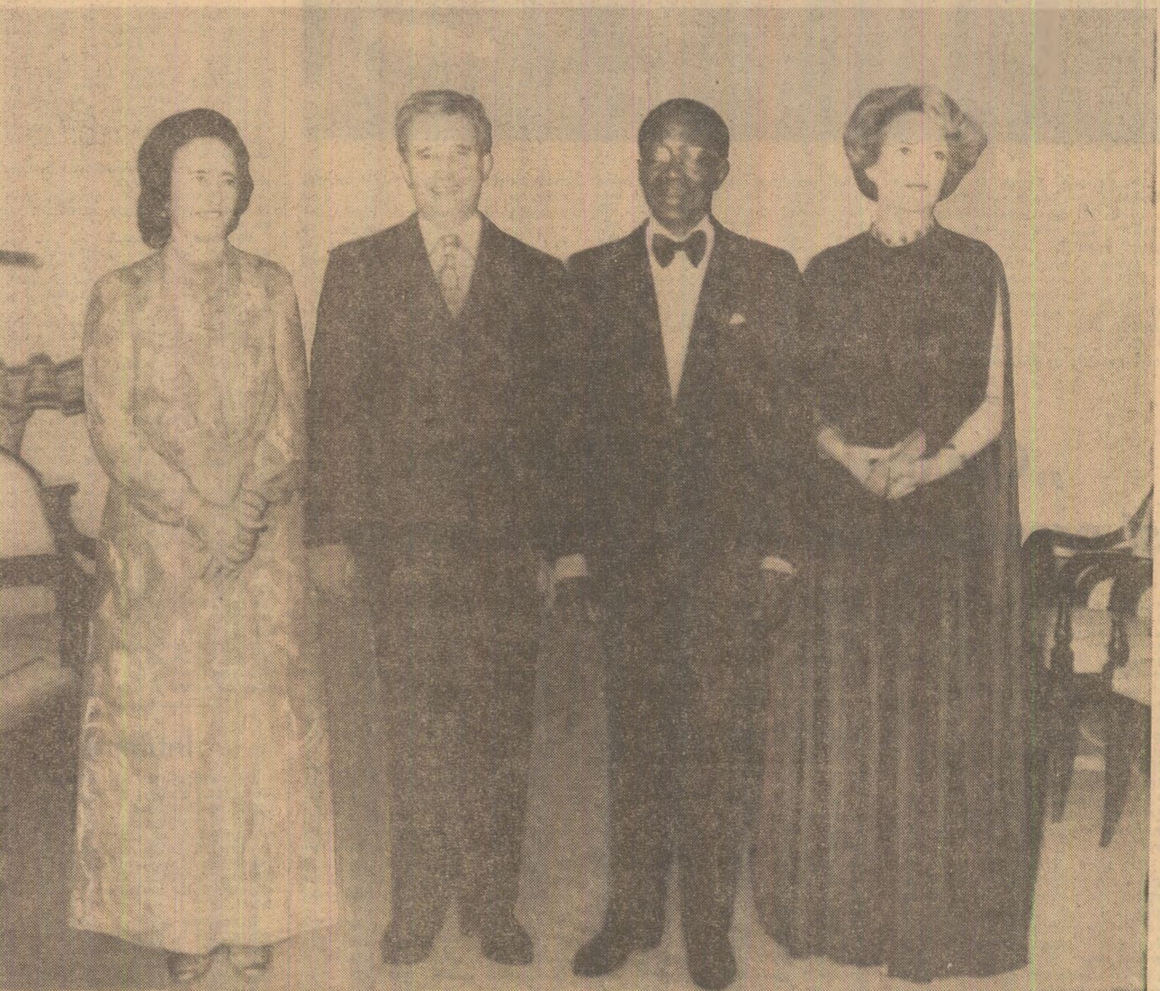
Imagine din timpul recepției de miercuri