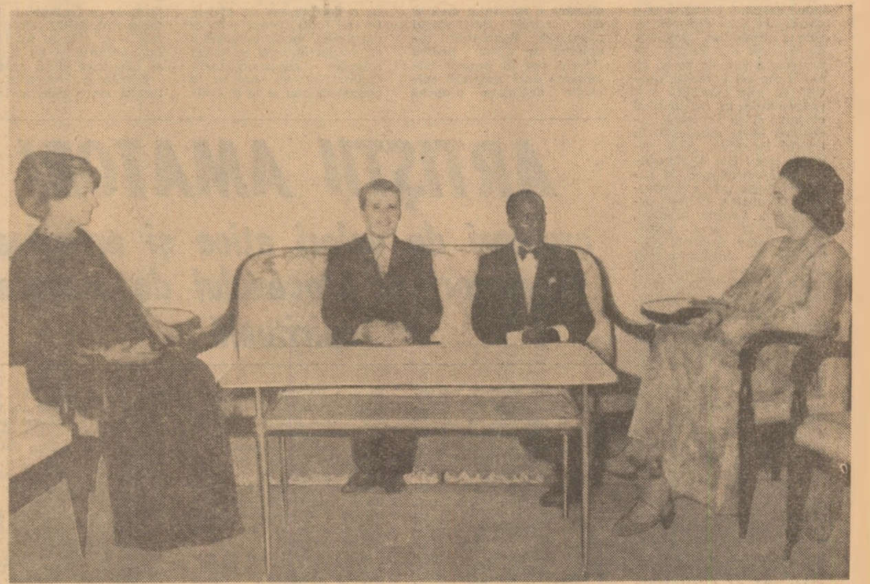
Moment din timpul vizitei