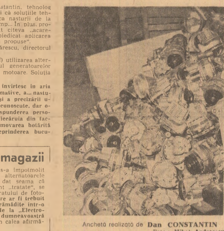
Anchetă realizată de Dan CONSTANTIN.

Încercînd să descurcăm filiera complicată în care s-a împotmolit aplicarea noului soluții ne-am întrebât: oare nu există alternativele necesare? Ajunși în depozitul întreprinderii, ne-am dat seama că astfel de soluții nu numai că există, dar după cum sînt arătate, se pare că prisoșesc. Imaginea surprinsă de obiectivul aparatului de fotografiat este revelatoare în acest sens. Alternatoarele, care ar fi trebuit să-și găsească locul în motoarele diesel D-30, zac îngrămădite într-o deordine de neînchipuit. Privii, tovarășii muncitori de la „Electro-precizia” Săcele, care este societate producător livrate de dumneaavostri întreprinderii „Timpuri noi”. După cum se vede, aici, în calea afirmării noului stă și barajul lipsei de spirit gospodăresc.