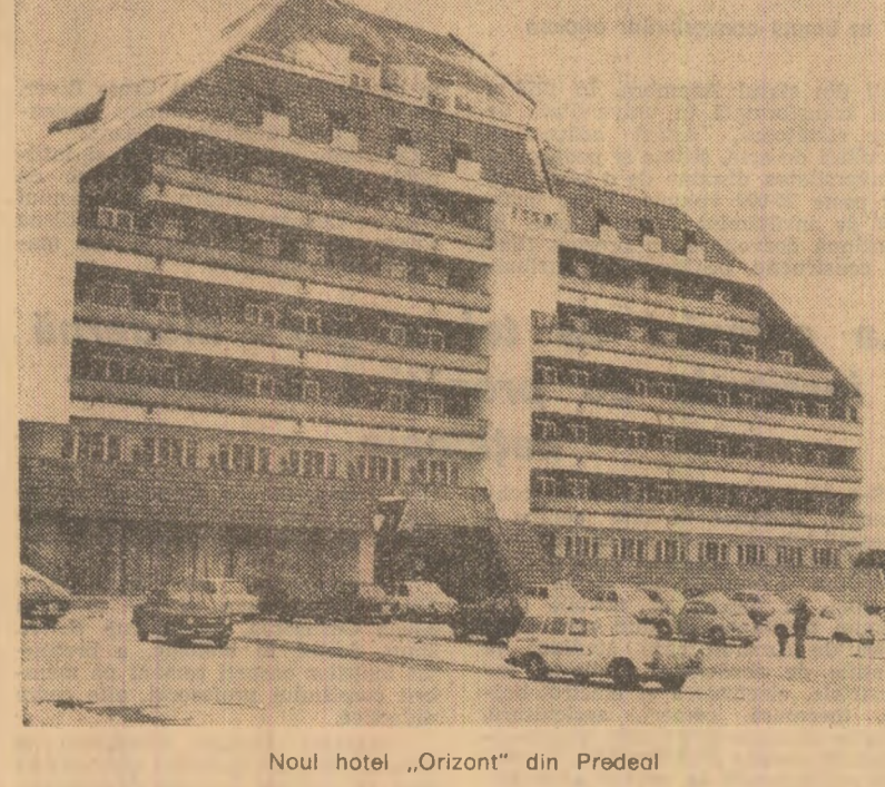
Noul hotel „Orizont” din Predeal

Pentru tratament: afecţiuni ale aparatului locomotor şi sistemului nervos — Balta Albă, Govora, Căciulata, Călimăneşti, Pucioasa, Baza, Ocna Sibiului, Geagiu, Mangalia, Herculane, Moneasa, Afecţiuni cardio-vasculare — Borşa, Tuznad, Buzias, Afecţiuni neuro-