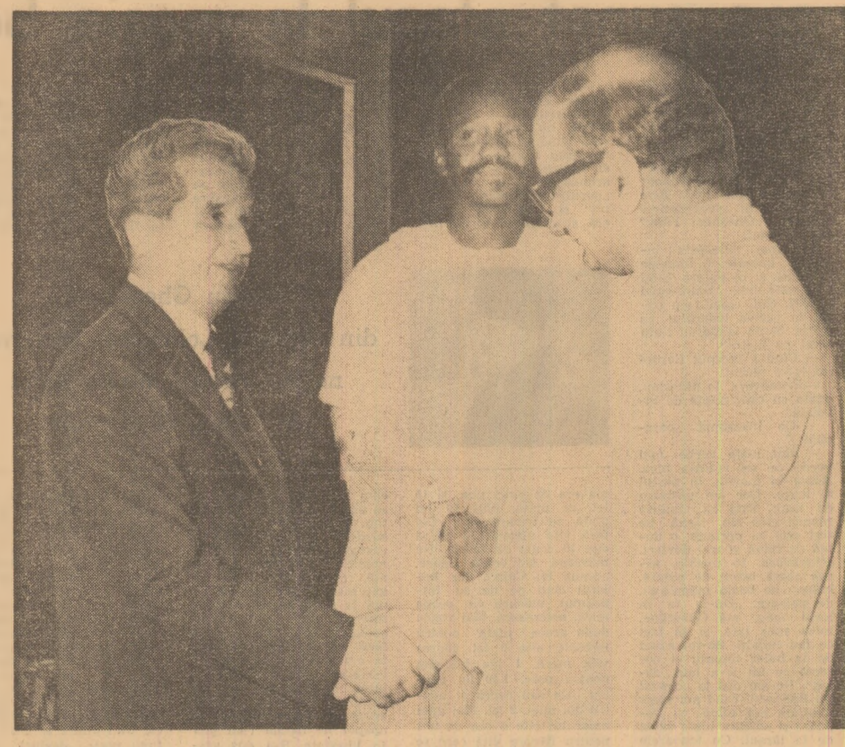
Aspect de la primirea șefilor misiunilor diplomatice