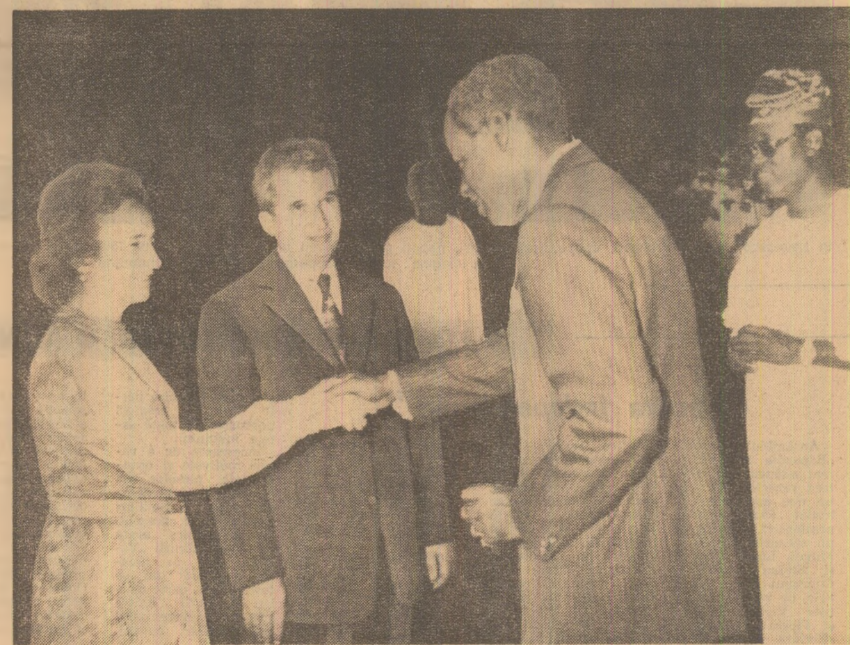
Cu prilejul recepției oferite în onoarea tovarășului Nicolae Ceaușescu și a tovarășei Elena Ceaușescu

În timpul recepției au fost intonate imnurile de stat ale României și Nigeriei.