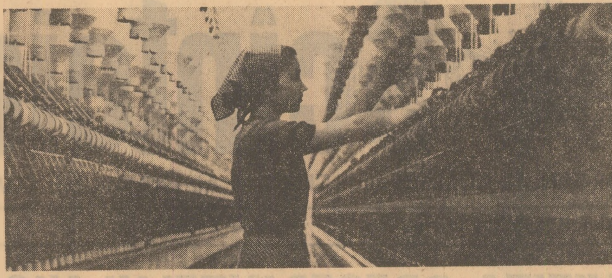
Pricepere, seriozitate şi îndeminare — lată ce l se cere unei lucrătoare într-o modernă filatură. (In Imagine: secvenţă de la Filatura din Corai)