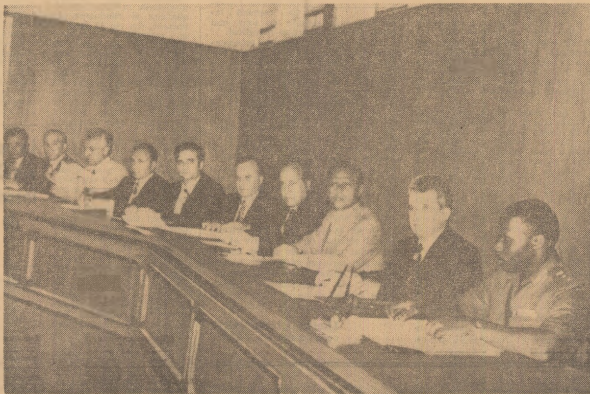
În timpul convorbirilor oficiale

La puțin timp după sosire, tovarășul Nicolae Ceaușescu și tovarășa Elena Ceaușescu au fost oaspeții studenților și profesorilor Universității din Calabar. Aici, cei 1.000 de studenți ai universității se aflau adunați pentru a-i primi sărbătorește pe solii poporului român. Rectorul universității, Ayoteiye