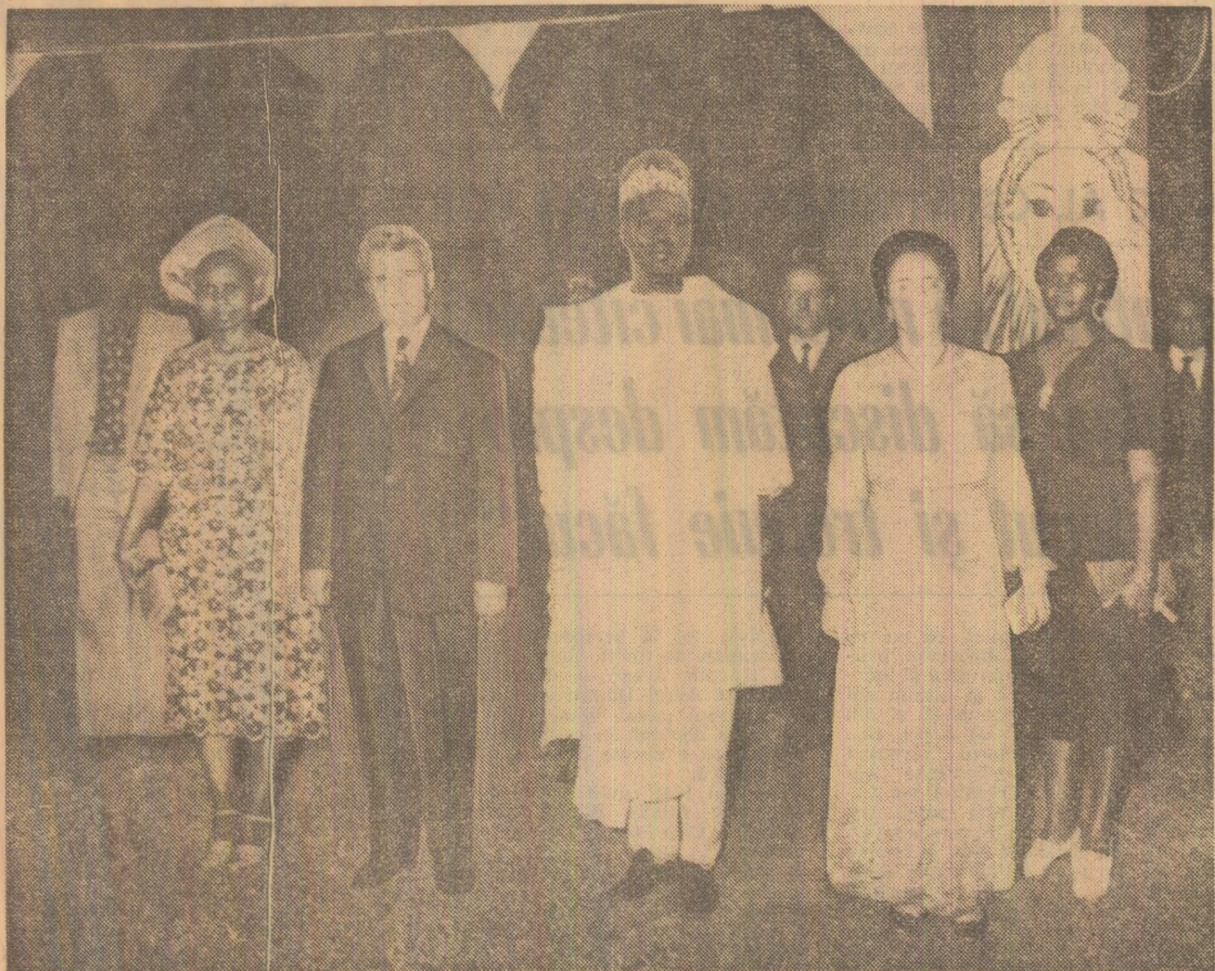
În cursul recepției de la Palatul guvernamental din Marina-Lagos