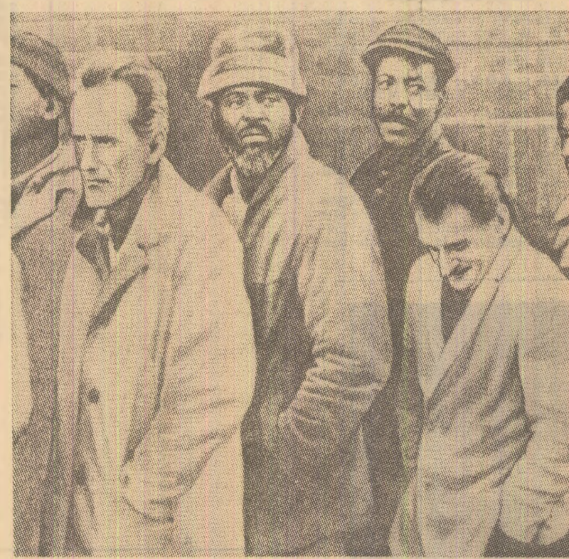
Unde ajunge condiția umană în lipsa dreptului la muncă. O zguduitoare fotografie apărută în ziarul american „NEW YORK DAILY NEWS”, în februarie 1977