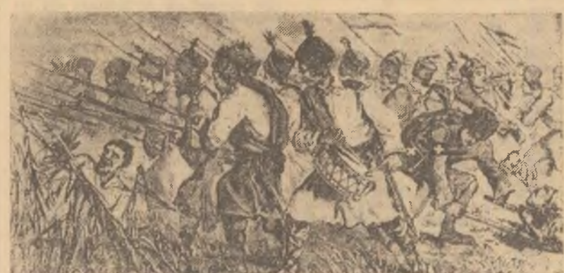
În sunetele goanei, dorbanții români atacă impetuos (Pictură de epocă)

Se oprise. „Ce-o face betonul? Nu-i ușor de lucrat să urmărești deteriorarea lui Martin Meister. Vorbind, el caută să se desprîndă de gîndurile a-