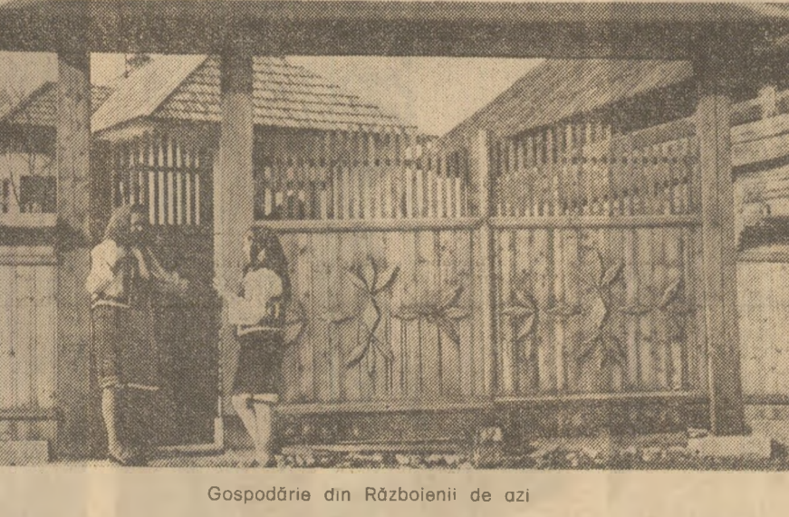
Gospodărie din Războieni de azi