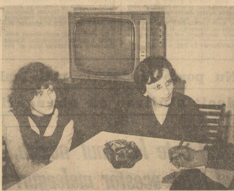
Parcul Tineretului, str. Treștiana nr. 13, bloc 15 — una dintre zecile de „adrese ale omenei” unde s-au mutat, în ultima săptămână, alte câteva din cele peste 2.500 de familii rămase fără adăpost.

— În ce condiții se vor realiza sarcinile planului de producție? — După cum este cunoscut, s-a aprobat în adunarea generală a oamenilor muncii planul de producție pe anul 1977. Prin acțiunea de resort avem asigurate alături materia primă — bumbac și fire poliestere — cit și desfacerea producției din acest an. Sintem hotărâți să atingem cote înalte în desfășurarea muncii, aducându-ne astfel o contribuție