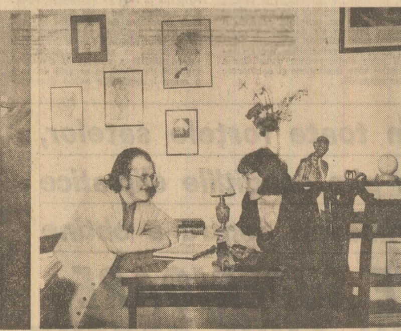
„Familia Grigoriu locuia în str. Pictor Grigorescu nr. 2, la etajul IV (foto 1). Compozitorul Costin Cazaban locuia deasupra pensiunii „Bulevard”, la etajul IV (foto 2).