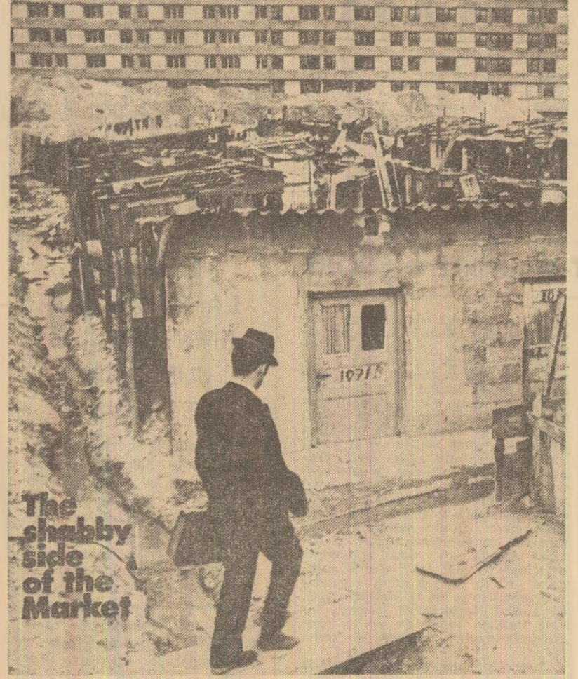
După o zi de muncă extenuantă, spre cartierele de cocioabe rezervoate imigranților la periferia marilor metropole

grantului la unele întreprinderi metalurgice din R.F.G. sau Elveția a junez unora la 80 de ore; drept urmare a însei măsurilor de protecție, numărul accidentelor de muncă, inclusiv mortale, printre muncitorii străini este DE DOUĂ ORI MAI MARE.