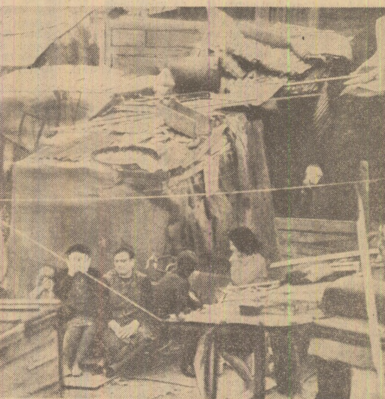
Fotografia de mai sus, reproducută ca și cea alăturată din săptămînalul britanic „Observer”, constituie un zguditor document acuzător la adresa condițiilor de trai ale muncitorilor ademeniți