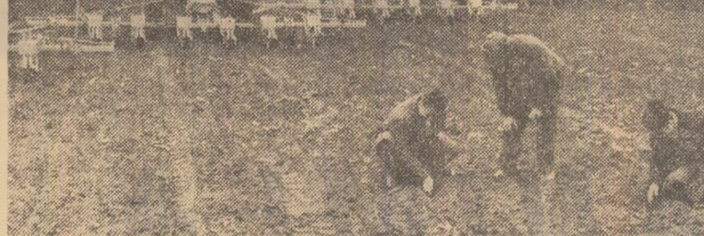
Pe ogoarele C.A.P. Purani, județul Teleorman, se lucrează intens la semănatul florisor-soarelui.

VRANCEA. La chemarea organizațiilor de partid și a comandamentelor locale, cooperatorii, mecanizatorii și specialiștii din unitățile agricole din județul Vrancea au fost prezenți duminică pe ogoare, efectuînd un volum important de lucrări. De exemplu, au fost însemnătate 829 ha cu floarea-soarelui. Ultimele hectare din cele aproape 9 000 ha destinate acestei culturi au fost însemnătate în cursul zilei de luni. Tot duminică au mai fost grăpate 990 ha de ogoare, iar pe 630 ha s-a pregătit terenul pentru porumb. Importante forțe de muncă au lucrat și în plantațiile viticole și pomnole, la curățatul pămîntului și la amenajarea sistemelor locale de irigații. (Dan Drăgulescu).