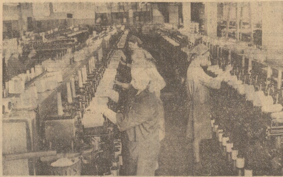
Întreprinderea „Viscofil” din Capitală: în atelierul de bobinaj, din cadrul secției de finisaj, de ieri se lucrează la întreaga capacitate