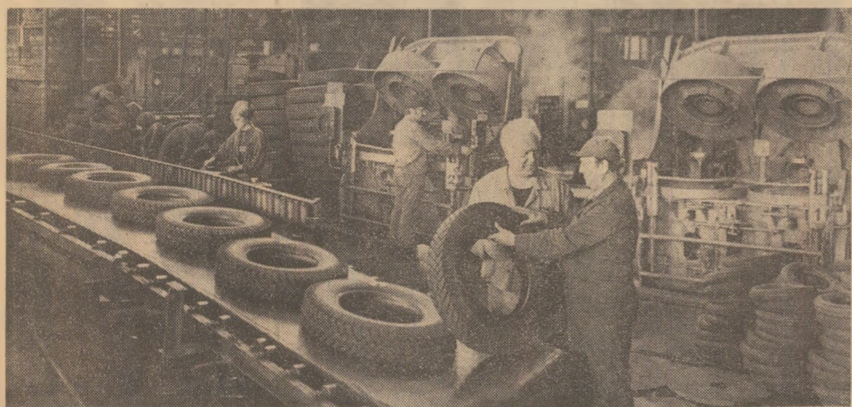
La întreprinderea „Danubiana” din Capitală — unitate puternic afectată de cutremur — întregul colectiv acționează energic pentru recuperarea pierderilor de producție și consolidarea clădirilor avariate. În fotografie: un aspect din secția vulcanizare, unde se finalizează producția întreprinderii.

N-am crezut niciodată în cenusa, nu m-am închinat decît soarelui verii, cîmîntii galbene de grîu și mării grele de sare și de albastru. N-am jurat decît pe sacul fir de iarbă și pe spicul de grîu, pe palmetele băltoare ale plucarilor și pe jumina din ochii copiilor. Cine tulbură culorile, cine aprinde cerul și pămîntul, nopțile și zilele, cine n-are urmași, cine nu are vecini și nici rude și nici ape curgătoare și nici munți, cine e făcut parcă din vînt, cine tulbură culorile lumii o să-și uturească lumina din priviri, și cenusa rămasă din el o s-o topească blînda apă curgătoare și inocență. Glorie voi aduce mereu doar devanții exploziei florilor, muncii sfînte și pasnice, solidarității umane. Ne vom aminti totdeauna eroismul ostasilor români, cîntînd cu infrigurare să salveze de sub dărîmăturile cutremurului viața fraților și confratrilor noștri, nu vom uita acele lunzi și sîruri de camioane pline cu piine mergînd spre București a doua zi după vinerea neagră, nu vom uita hotărîrea întregului popor condus de partid de a reclădi și consolida ce secundele spele au distrus. Cineva mi-a povestit cum la o mare unitate din industria chimică muncitorii din schimbul de noapte