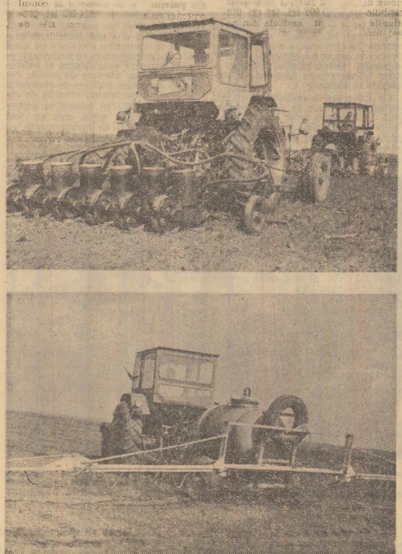
Pe terenurile stațiunii didactice Belciugatele, a Institutului agronomic „Nicolae Bălcescu”, se lucrează de zor la semănatul ultimelor hectare cu sfeclă de zahăr (fotografia de sus) și la erbicidarea terenului (fotografia de jos).