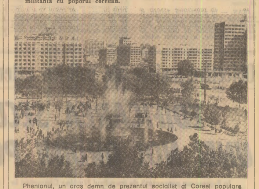
Phenianul, un oraș demn de prezentul socialist al Coreei populare

Oamenii muncii din R.P.D. Coreeană înregistrează noi realizări notabile în toate domeniile activității economico-sociale: în industrie, în agricultură, transporturi, în învățămînt, în știință și tehnică. Aceste multiple succese, obținute de poporul coreean, sub conducerea Partidului Muncii, în frunte cu tovarășul Kim Ir Sen, care împlineste astăzi 65 de ani, sint urmărirea cu vie satisfacție și bucurie de poporul român, unit prin trănietă legături trîștești, de solidaritate milităntă cu poporul coreean.