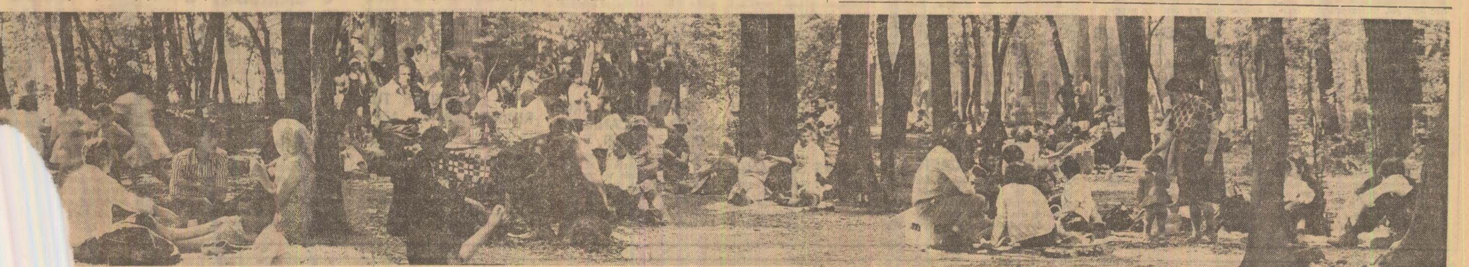
De 1 Mai, în pădurea Băneasa