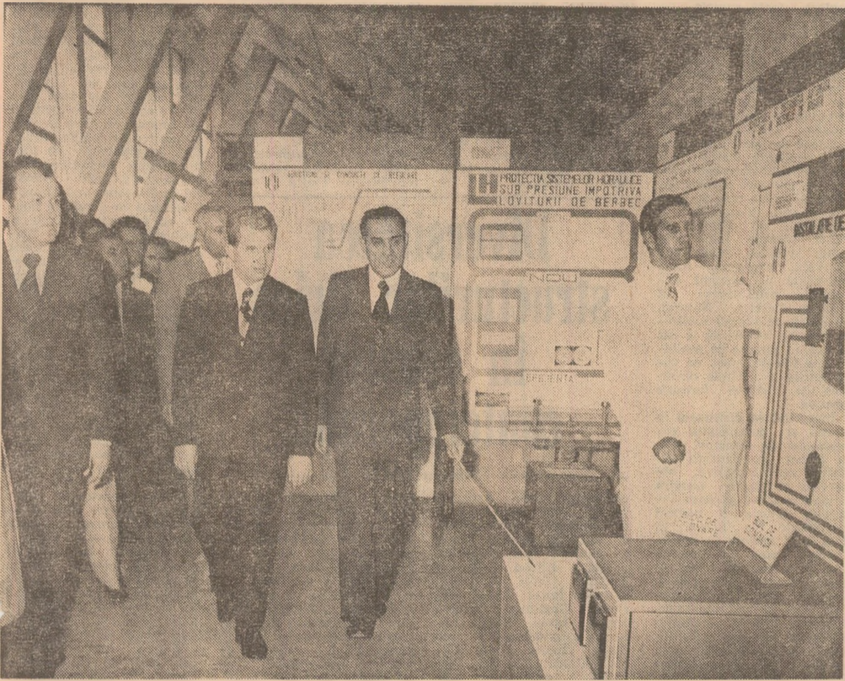
(Urmare din pag. 1)