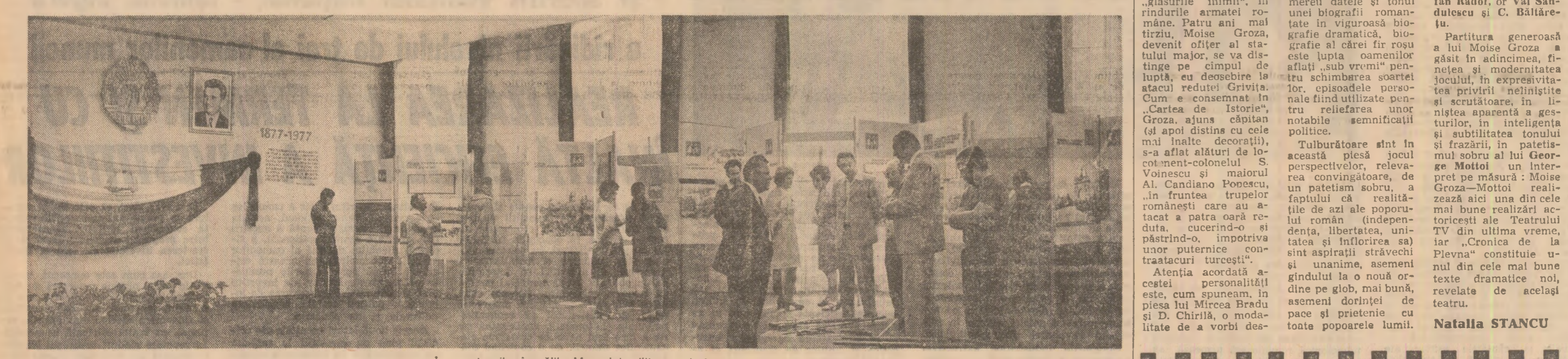
In aceste zile, în sălile Muzeului militar central

Istoria a arătat că mişcarea noastră muncitorească s-a dovedit la înălţimea marilor sale răspunderi. Într-adevăr, după mai multe decenii, în cursul cărora politica claselor exploatare şi politica muncitorilor puternici imperialiste au dus la cîntirea gravă şi în cele din urmă la compromiterea independenţei, cucerite prin grelele jertfe ale maselor largi, poporul român şi-a dobîndit deplină independenţă sub steagul Partidului Comunist Român, în anul revoluţiei populare şi al construcţiei socialiste, cînd a devenit pentru prima oară singur şi într-ututul stăpîn pe destinele sale. A început astfel o nouă epocă în viaţa naţiunii, epocă împlinirii celor mai înalte aspiraţii de libertate şi progres ale poporului, a înfloririi multilaterale a României socialiste.