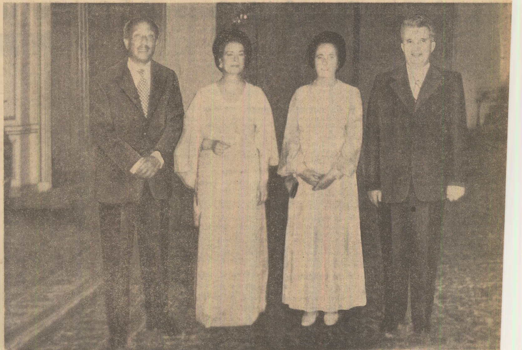
În timpul dîneului oficial

de caldă prietenie, de stimă și înțelegere reciprocă, specifică bunelor raporturi care s-au statornicit și se dezvoltă rodnic între țările și popoarele noastre, precum și contactelor dintre cei doi șefi de stat.