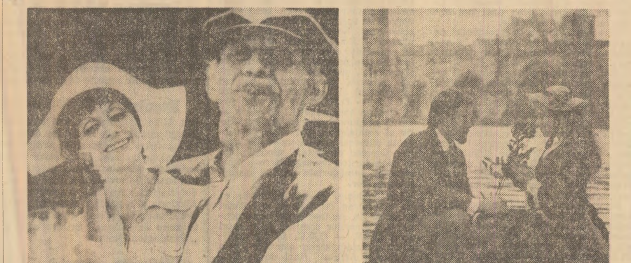
12 mai: spectacol de gală cu filmul „Timpul dragostei și al speranței”; 13 mai: „In-înălțea-pădurii”; 14 mai: „Timpul sterge totul”...