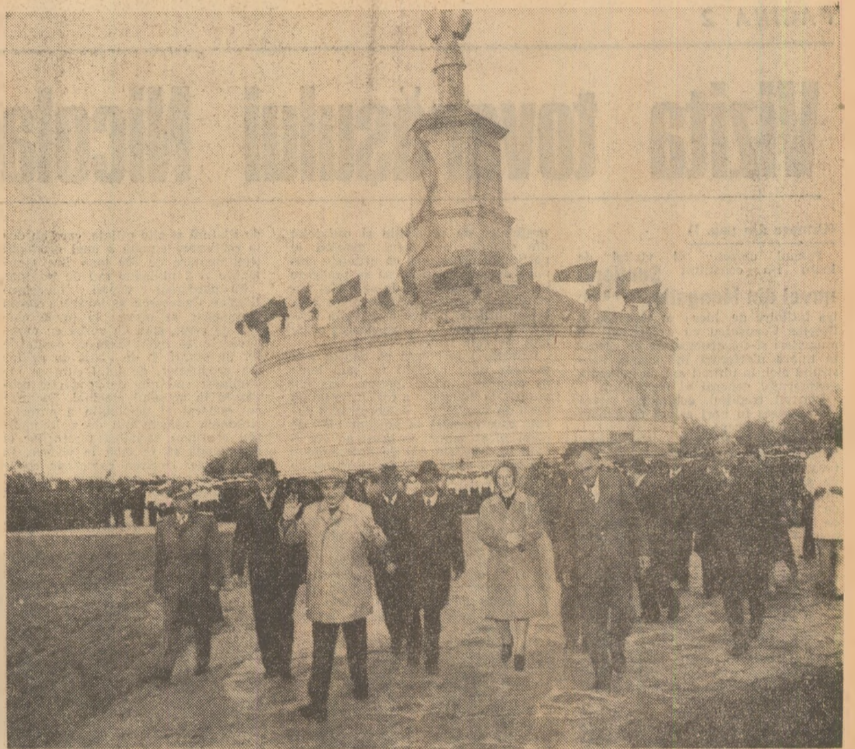
La monumentul de la Adamclisi