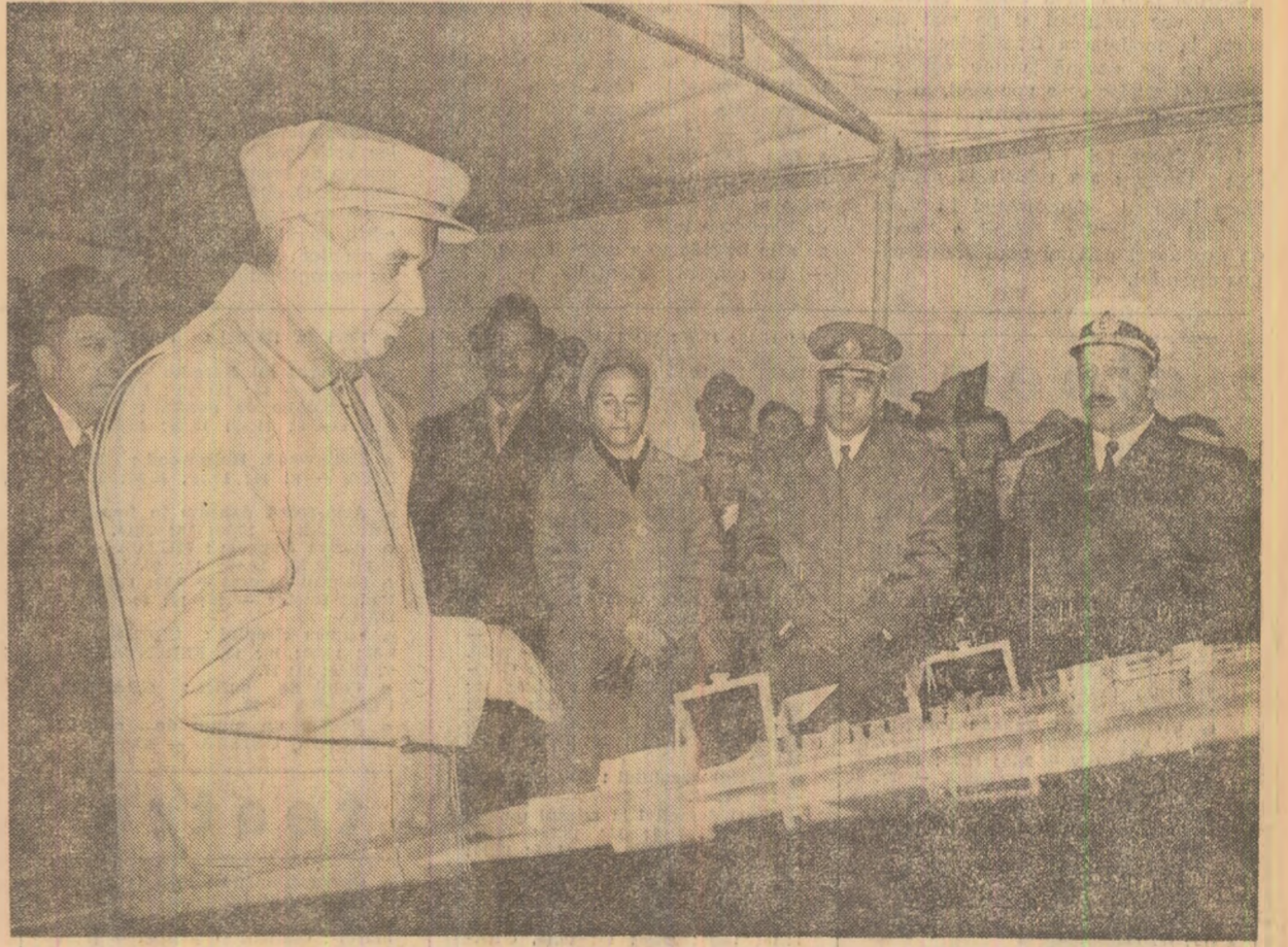
Imagini din timpul vizitei la Șantierul naval din Mangalia