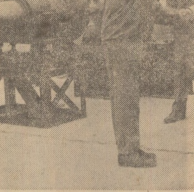
Minierălierul „Callatis” — realizat înainte de termen

În această zi, secretarul general al partidului, preşedintele Republicii Socialiste România, şi tovarăşa Elena Ceauşescu au participat la ceremo-