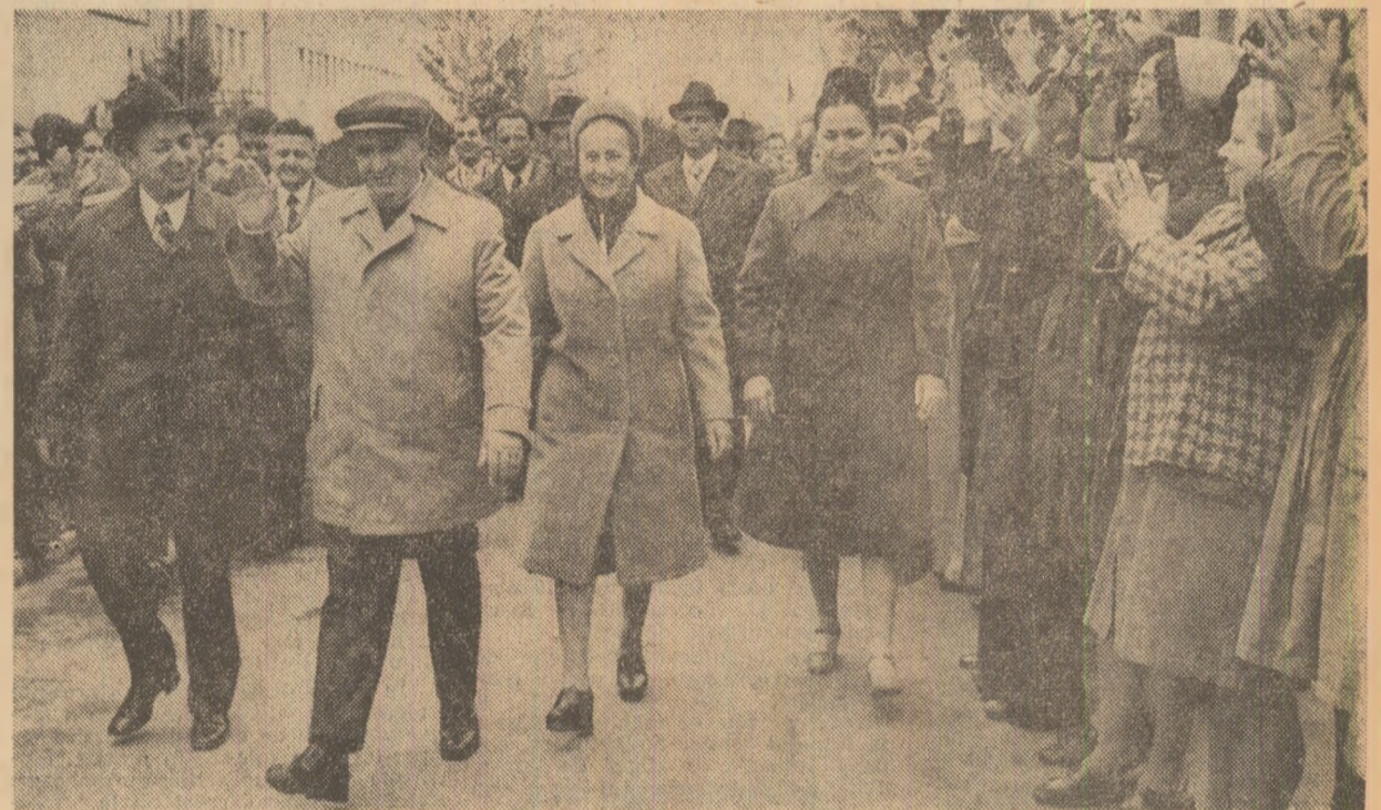
Președintele, entuziaste manifestări de dragoste și înalt respect