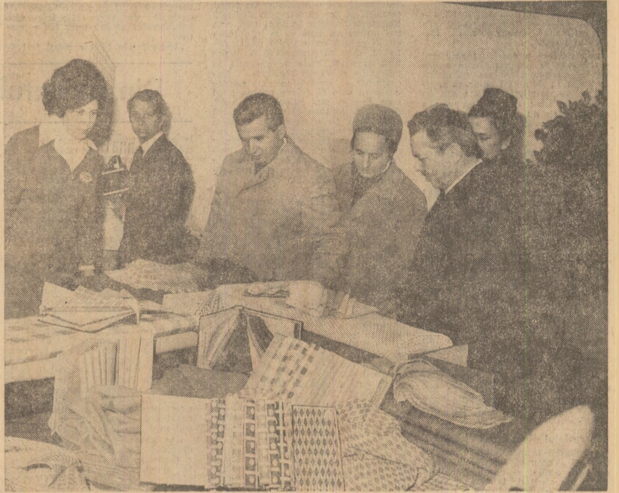
La întreprinderea integrată de lină

(Aplauze puternice, prelunghite. Urale și ovaii îndelungate. Se scandează minute în șir „Ceaușescu—P.C.R.” „Ceaușescu și poporul!”. Într-o atmosferă de puternică însuflețire, toți cei prezenți la marele miting aclamă îndelung pentru Partidul Comunist Român, pentru Comitetul său Central, pentru secretarul general al partidului, tovarășul Nicolae Ceaușescu).