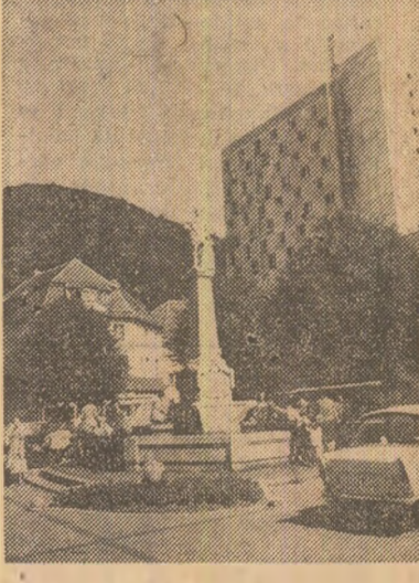
Din peisajul Turingiei de azi