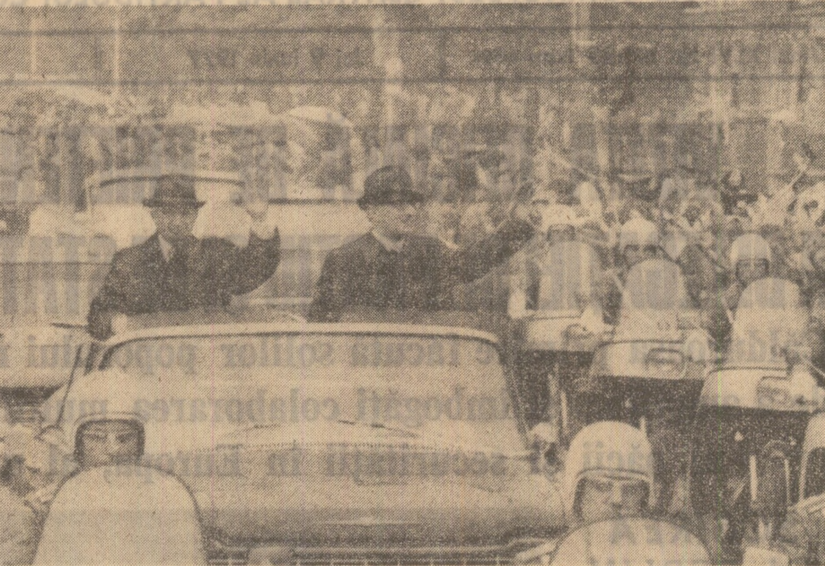
Salutina mulțimeo pe străzile Berlinului

— În ce măsură sunt satisfăcuți de nivelul și de conținutul activității desfășurate în cadrul consiliului? În ce măsură este satisfăcută activitatea desfășurată în cadrul consiliului? În ce măsură este satisfăcută activitatea desfășurată în cadrul consiliului? În ce măsură este satisfăcută activitatea desfășurată în cadrul consiliului?