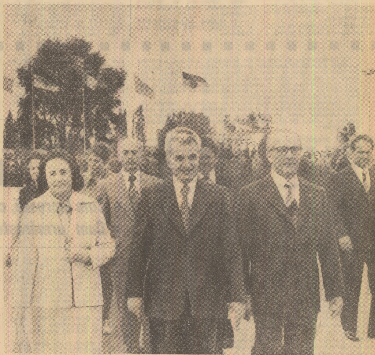
Imagine de la sosirea pe aeroportul „Schönefeld”