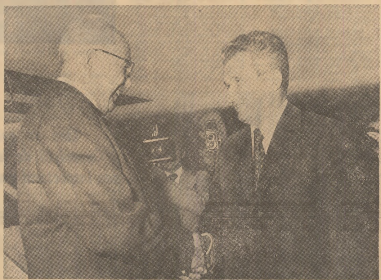
La sosire, pe aeroportul Otopeni