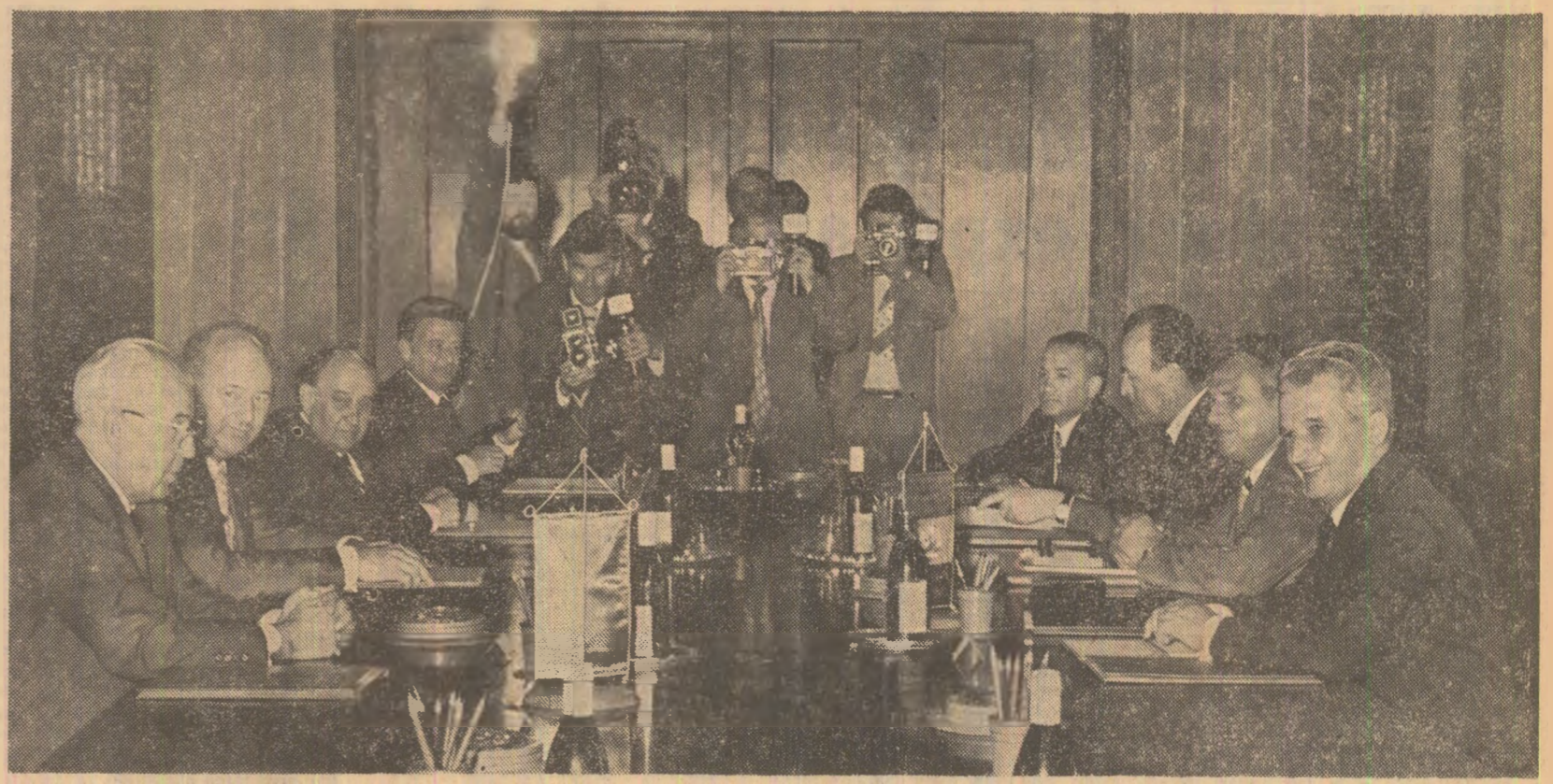
În timpul convorbirilor oficiale

Stimate tovarășe Ceaușescu, Stimai tovarăși și prieteni români, Permiteți-mi ca, în numele întregii delegații cehoslovace și al meu personal, să vă mulțumesc în mod cel mai cordial pentru primirea plăcută, tovarășescă și prietenească, care ne-a fost făcută în frumoasa dumneavoastră țară de locuitorii Bucureștiului, de reprezentanții Partidului Comunist Român, al Consiliului de Stat și ai Guvernului Republicii Socialiste România, din partea tovarășului Nicolae Ceaușescu. Această primire plăcută exprimă sentimentele profunde de prietenie și simpatie ale poporului român și ale comunistilor români față de popoarele Cehoslovaciei și față de Partidul Comunist din Cehoslovacia. Mulțumesc, de asemenea, în mod cel mai sincer pentru cuvintele calde pe care le-ați rostit aici, stimat tovarășe Ceaușescu, la adresa partidului și a țării noastre, a poporului cehoslovac. Îngăduiți-mi să transmit, totodată, salutul nostru sincer și tovarășesc comunistilor și poporului Republicii Socialiste România. Dragi tovarăși, Și această vizită constituie o expresie a relațiilor și colaborării care se dezvoltă cu succes între partidele și țările noastre, frățești, între poporul cehoslovac și poporul român. În convorbirile de azi am putut să continuăm bunele tradiții de prietenie și colaborare, să facem