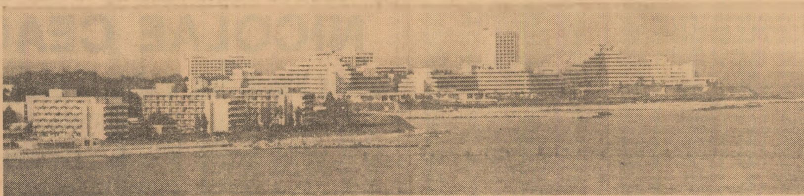
Celor ce doresc să-și petreacă concediul pe litoralul Mării Negre, în stațiunile Neptun, Mamaia, Eforie Nord, Jupiter, Aurora, Venus, Saturn, oficiile județene de turism le pun la dispoziție în această perioadă bilete pentru odihnă, asigurându-le cazarea în hoteluri...