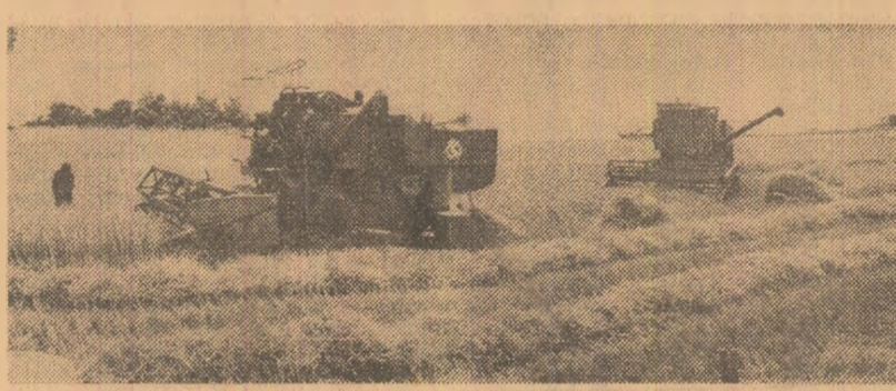
La C.A.P. Vinători, județul Galați, recoltarea grâului se desfășoară intens.