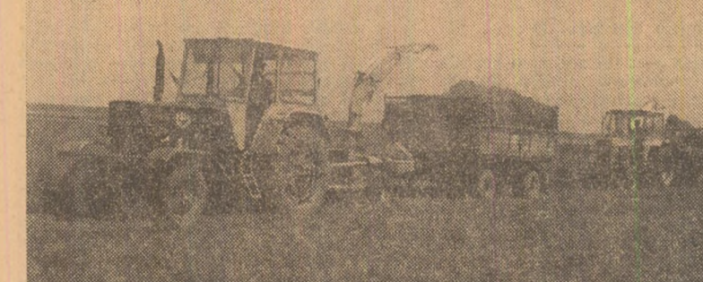
La C.A.P. Cervenia, județul Teleorman, se recoltează furajele pentru insulozare