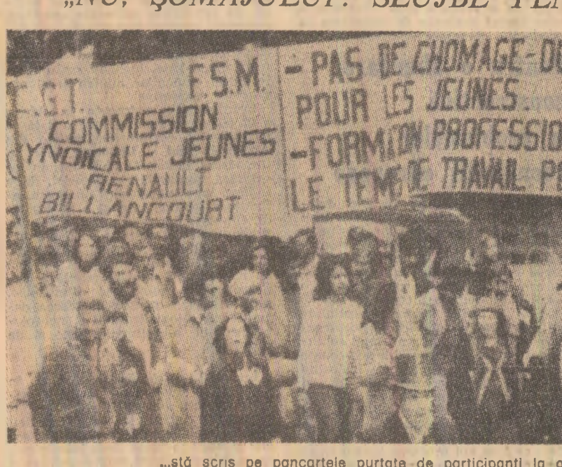
...stă scris pe pancartele purtate de participanți la o mare demonstrație